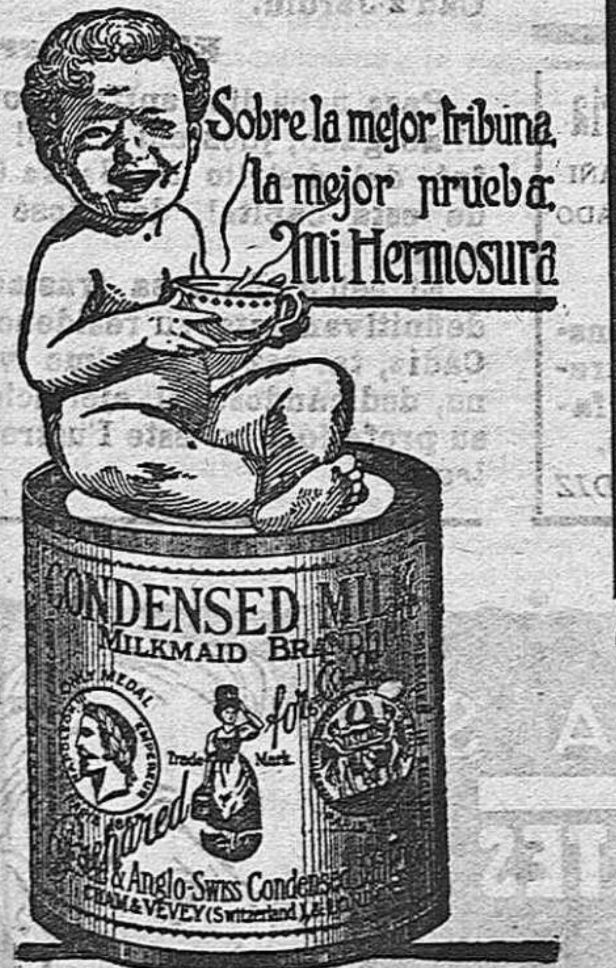
Sobre la mejor tribuna, la mejor prueba. Mi Hermosura