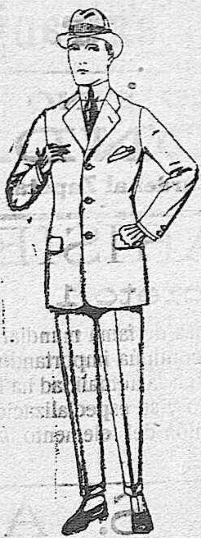
Trajes de cheviot, patén, etc. de ptas. 38 a 156

SUCURSALES: Madrid, Barcelona, Alicante, Almería, Bilbao, Cádiz, Cartagena, Gijón, Granada, Málaga, Palma de Mallorca, Santander, Sevilla, Valencia, Valladolid, Zaragoza