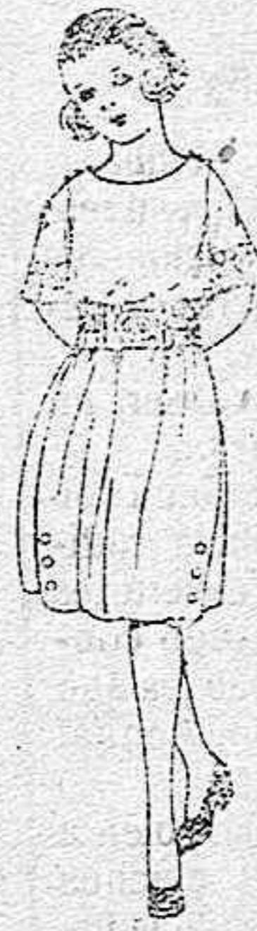
Vestidos de sarga inglesa, lanilla, etc., en azul y color, adornos bordados, para niñas de 4 a 9 años de ptas. 35 a 45