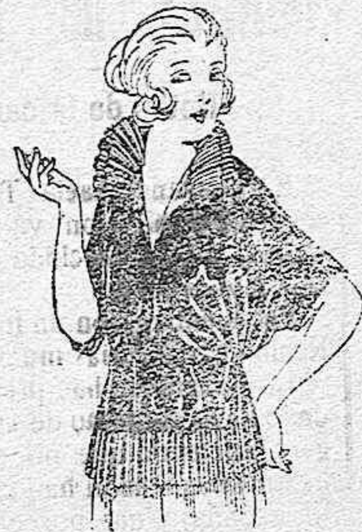
Blusas de charmeuse, granadina, etc., en negro, azul y color. de ptas. 30 a 55