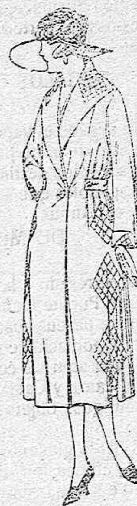
Abrigos de gamuza, ratina, etc., en negro, azul y color, adornos bordados seda. de ptas. 65 a 110

Gorras, Sombreros, Cinturones, Calcetines, Corbatas, Paraguas, Pañuelos, Fajas, Ligas Tirantes, Cuellos lanas, etc., etc.