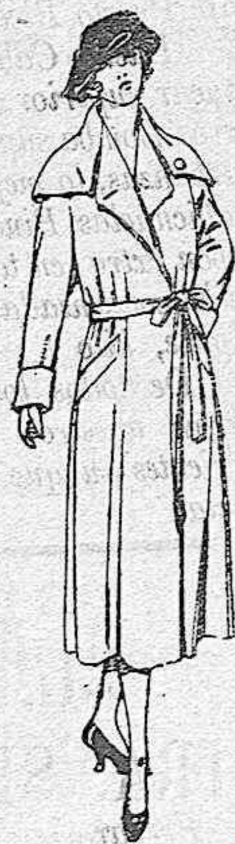
Abrigos de seda impermeables. de ptas. 130 a 225

Ropas confeccionadas para CABALLERO, SEÑORA, NIÑO Y NIÑA