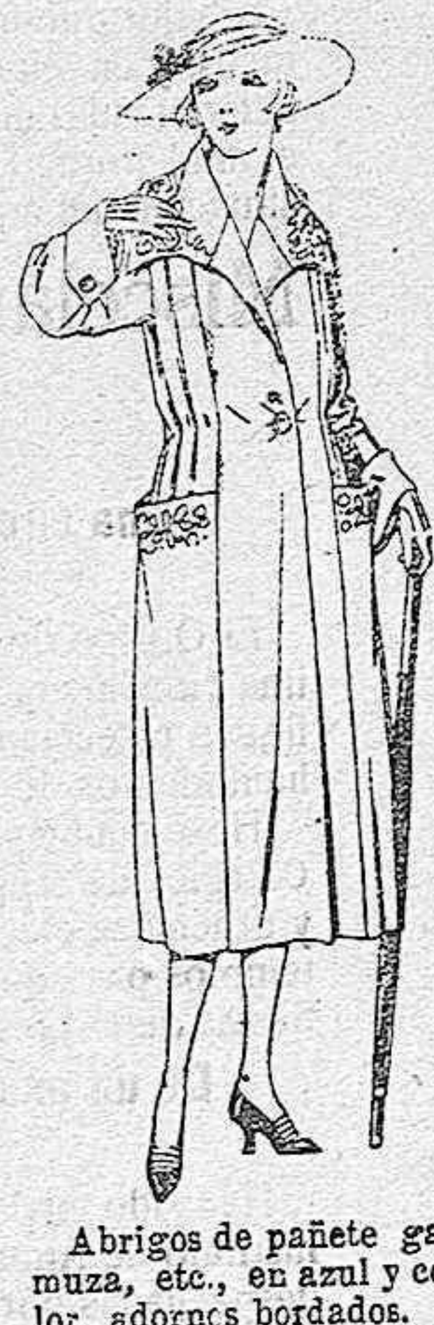
Abrigos de pañete gamuza, etc., en azul y color, adornos bordados. de ptas. 70 a 120