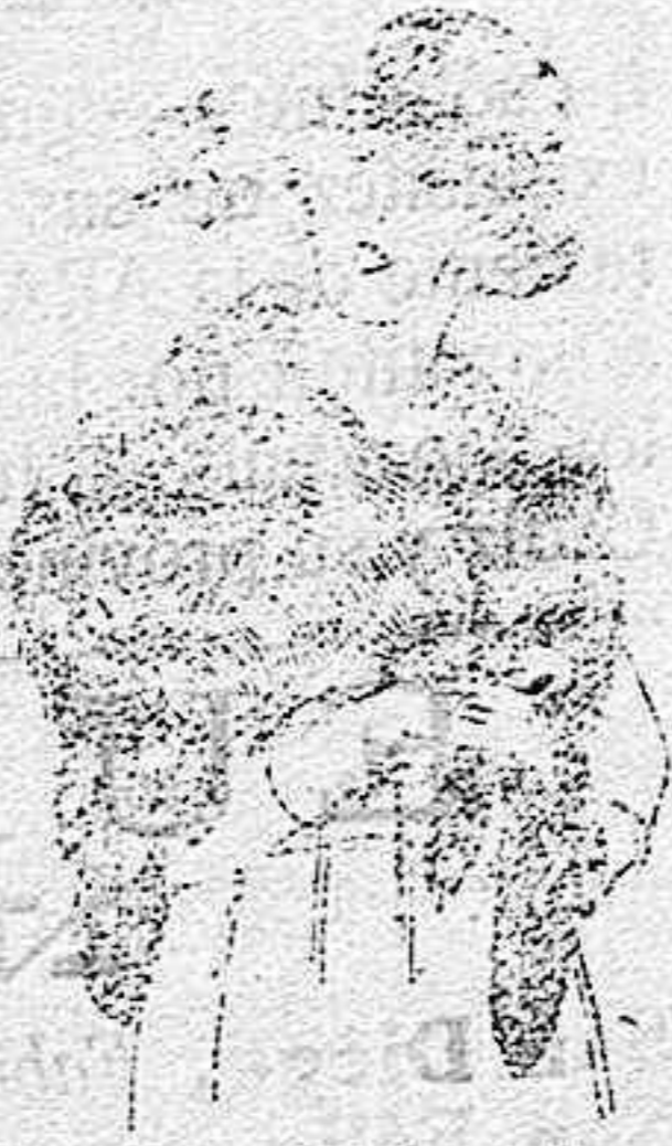
Cuello piel Renardina, en blanco, marrón, gris y negro. de ptas. 18 a 40