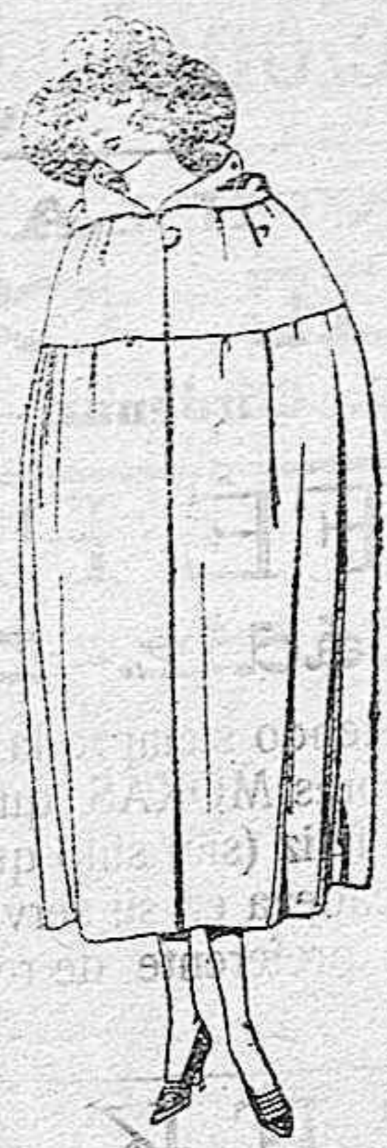
Capas de gabardina, terciopelo de lana, etc., diferentes colores. de ptas. 100 a 150