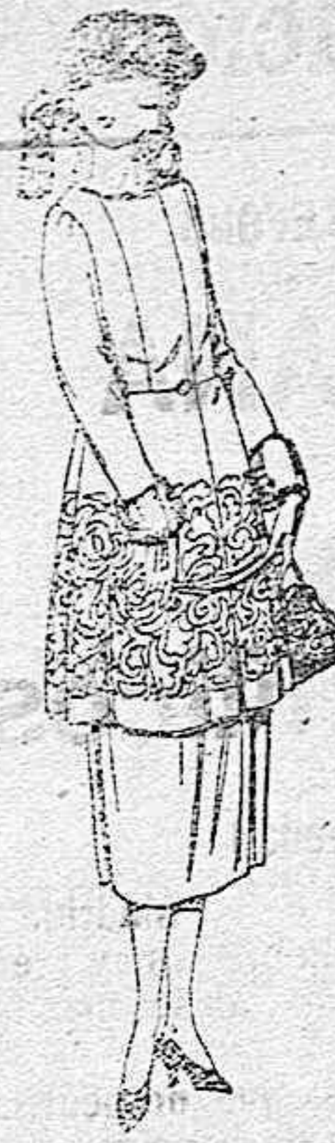
Trajes de gamuza, adornos bordados y con piel, en negro, azul y color. de ptas. 180 a 230