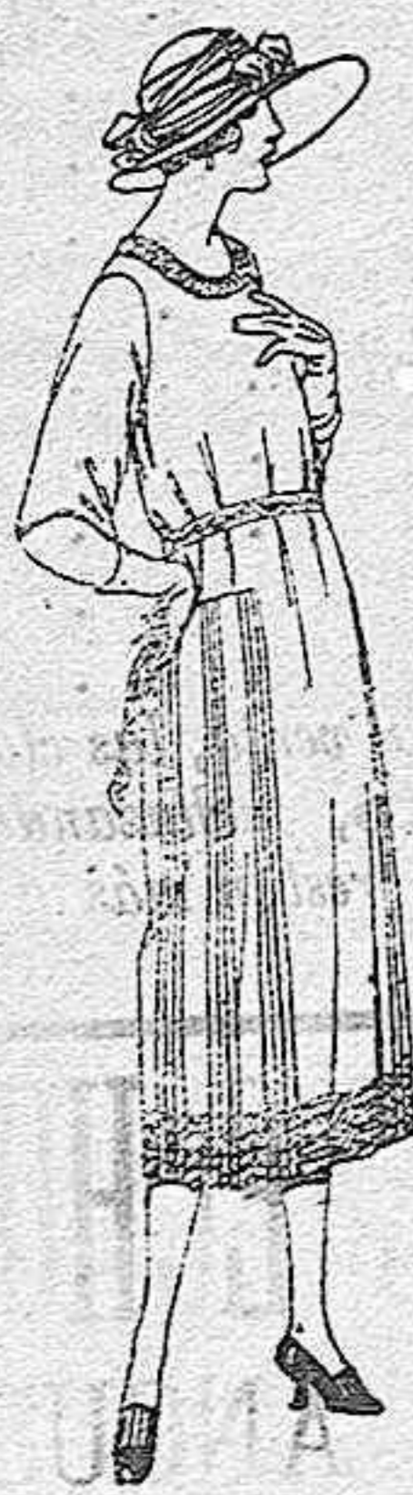
Vestidos de estambre, tricofina, gabardina, etc., en negro, azul y color, adornos bordados. de ptas. 110 a 150