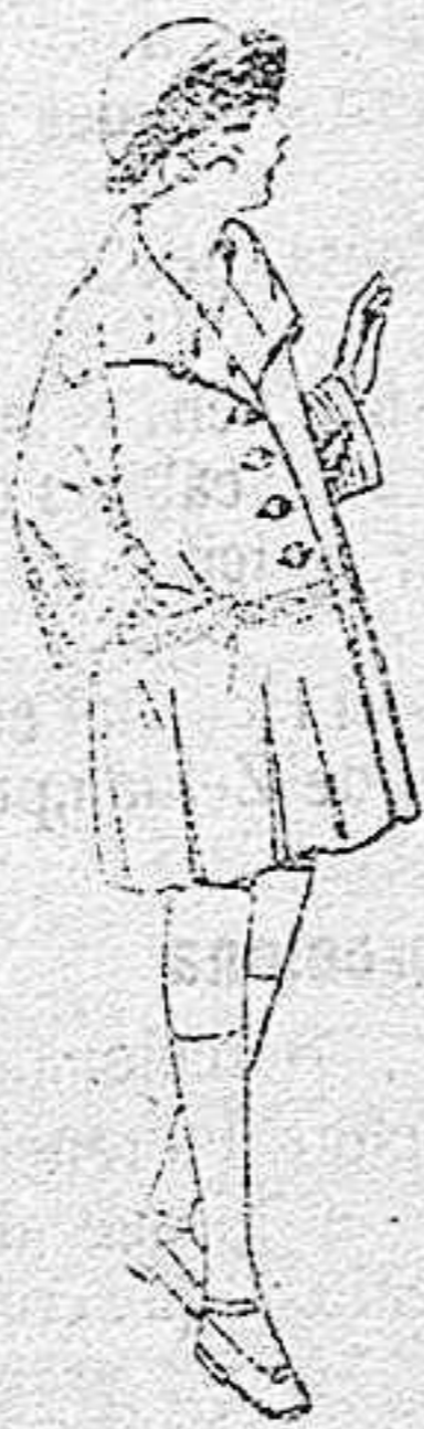
Abrigos de gamuza, ratina, etc. en azul y color, para niñas de 4 a 12 años de ptas. 35 a 60