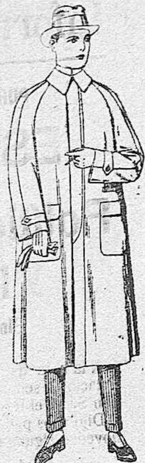
Impermeables raglán, en azul y colores. de ptas. 40 a 170