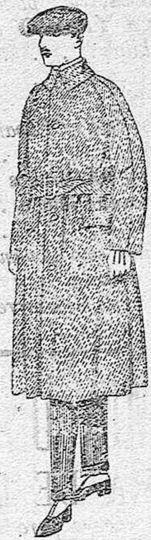
Gabanes de patén, cheviot o cower. de ptas. 55 a 160