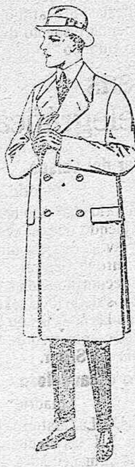
Gabanes de patén, gamuza cower. de ptas. 60 a 200