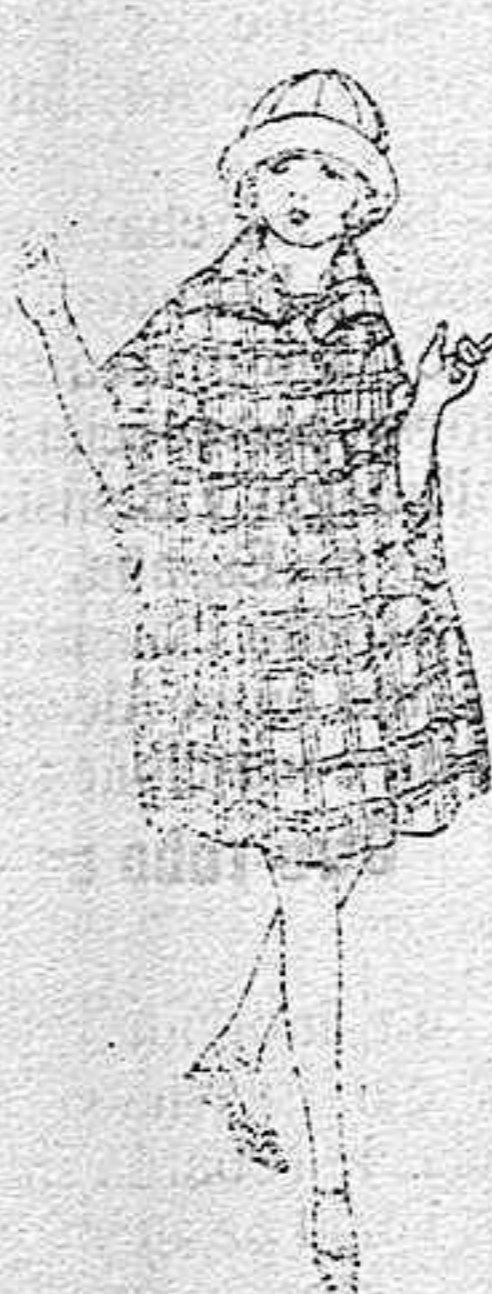
Capas de pañete, cheviot, etc., diferentes colores y dibujos, para niñas de 4 a 9 años de ptas. 25 a 58