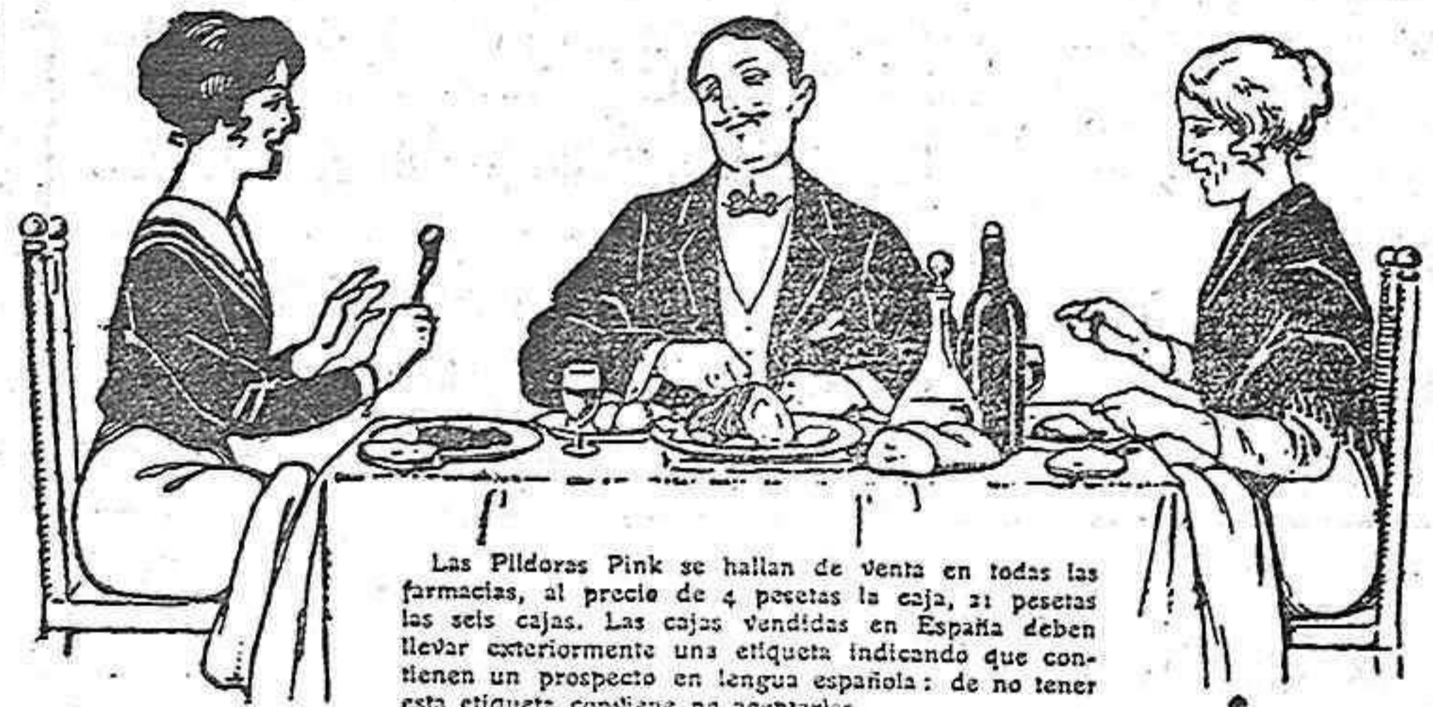
Las Píldoras Pink se hallan de venta en todas las farmacias, al precio de 4 pesetas la caja, 21 pesetas las seis cajas. Las cajas vendidas en España deben llevar exteriormente una etiqueta indicando que contienen un prospecto en lengua española; de no tener esta etiqueta conviene no aceptarlas.