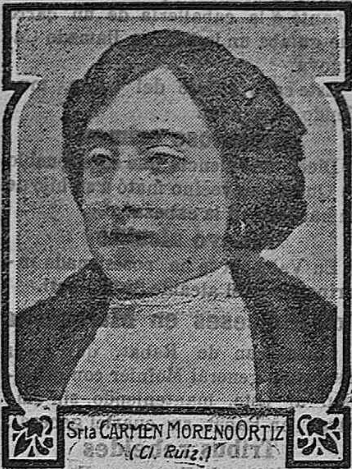
He aquí un ejemplo entre miles de ellos:

Sea de la alta sociedad, sea sencillamente obrera, la mujer tiene necesidad de un medicamento para sostener su débil organismo. Poquitas mujeres poseen un temperamento harto fuerte para que puedan prescindir de una medicación tónica. Gran número hay de medicamentos tónicos, regeneradores; por consiguiente, si el favor general va á las Píldoras Pink quiere decir que, en opinión de las mujeres, las Píldoras Pink son las que mejor corresponden á sus necesidades, esto es, las liberan mejor de sus incomodidades.