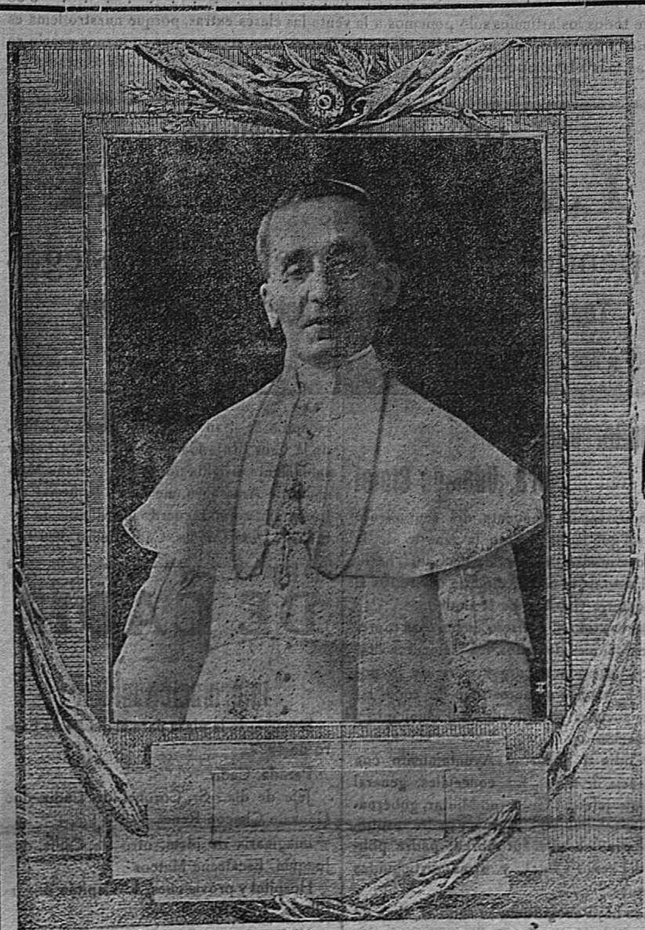
S. S. el Papa Benedicto XV.