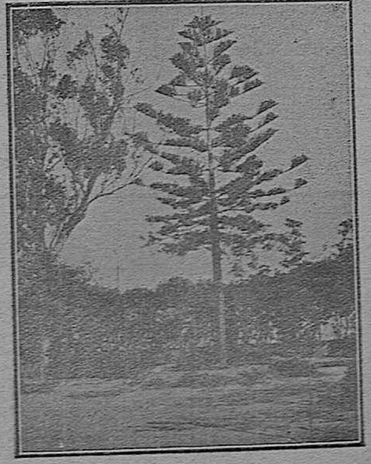
Vista parcial del paseo «Antonio Capriles»