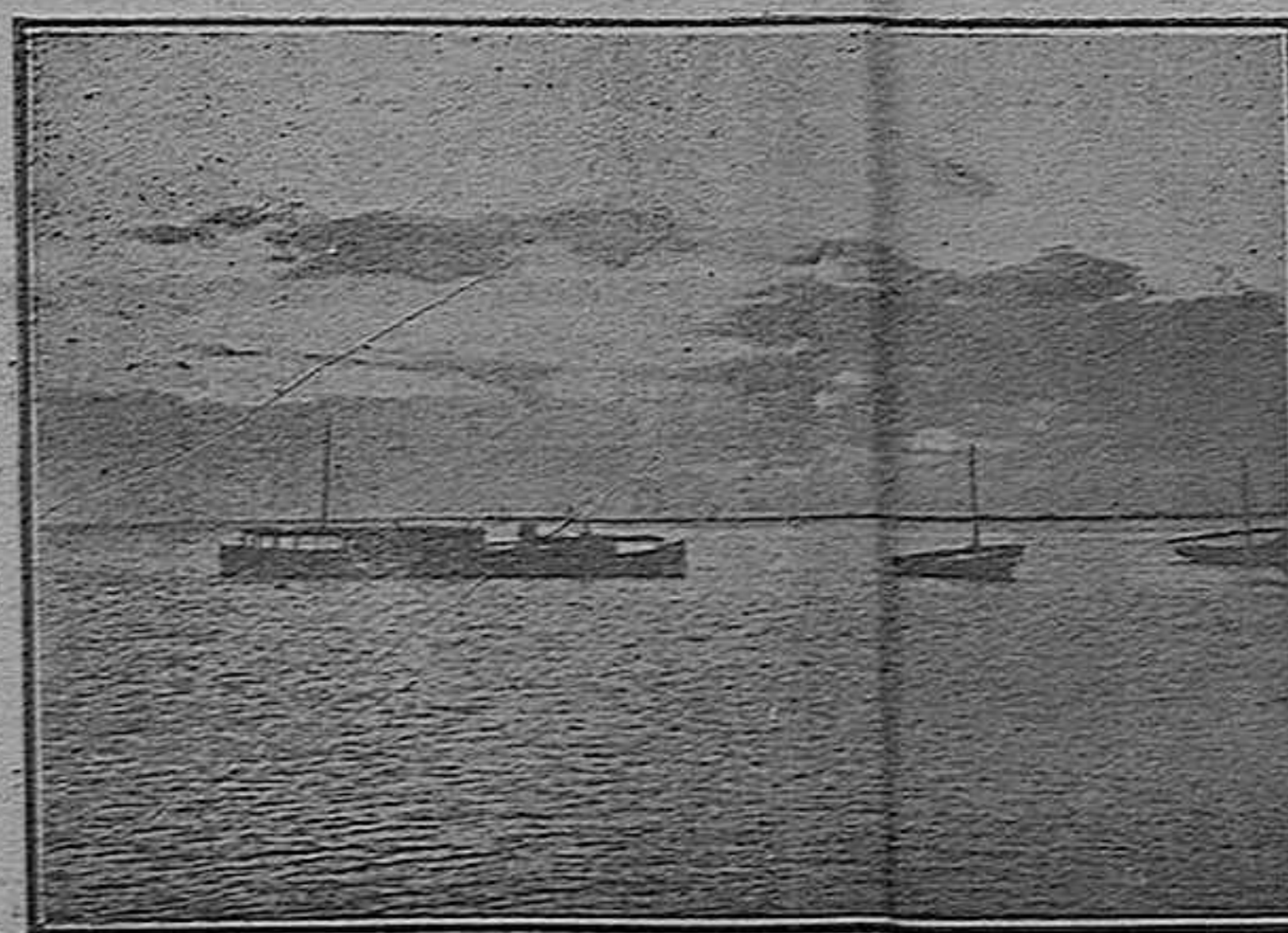
Una vista del muelle «Almirante Cervera»

Después de terminada la función principal, todos los restaurantes, fondas y establecimientos, se veían completamente abarrotados de público, viéndose conocidas familias de población