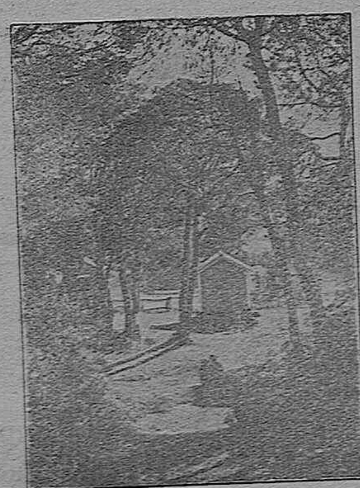
La «Avenida Gámez Ojeda», desde el pinar