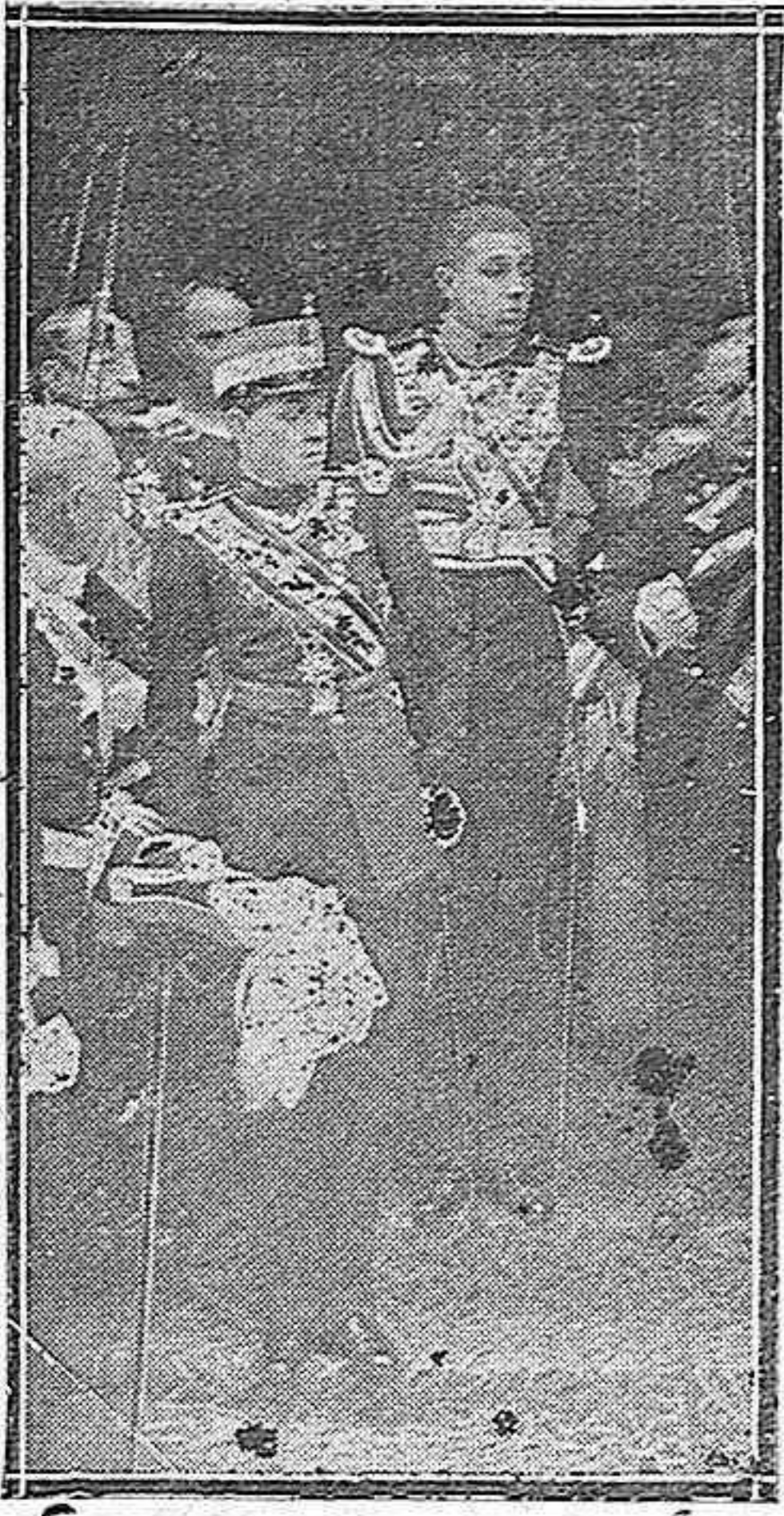
En el centro, de izquierda a derecha, el Príncipe de Asturias y el Infante Don Jaime, al salir de la Fiesta de la Grandeza de España, celebrada en San Francisco el Grande.

Los aviadores Loriga y Gallarza son grandiosamente recibidos en Manila.