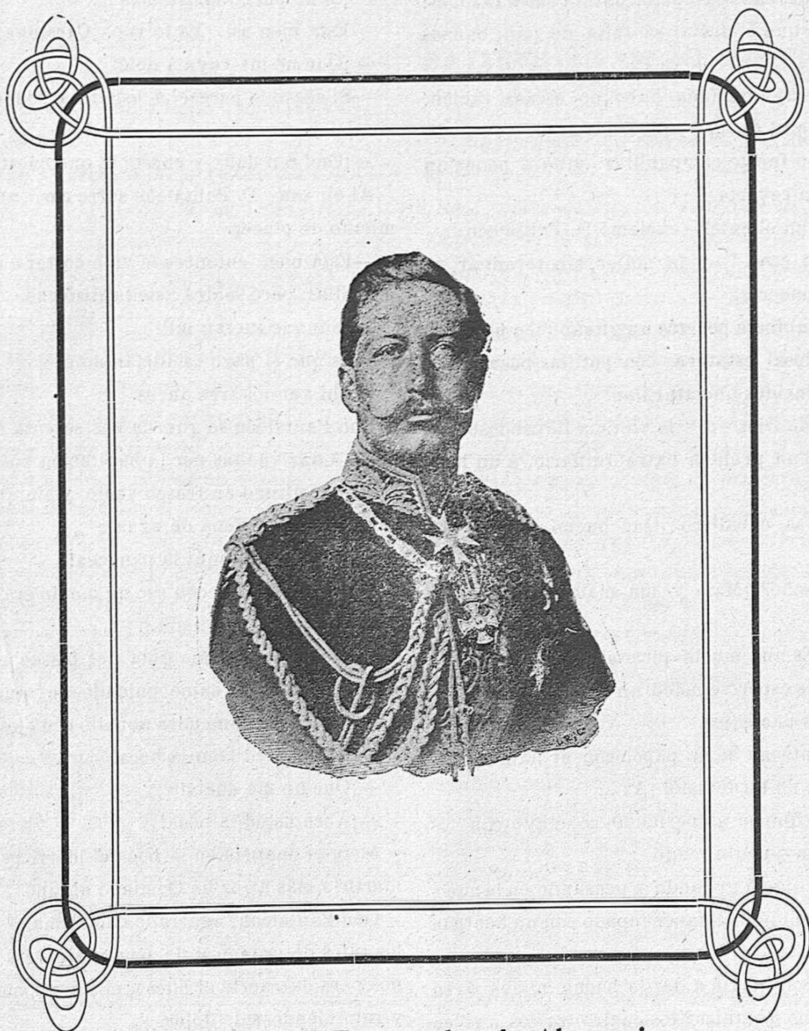
Guillermo II, Emperador de Alemania.

Es la figura del día, que tiene en espectación al Universo entero. La atención mundial estará puesta durante mucho tiempo en el Kaiser, que parece, por sus hechos, que quiere emular á Napoleón Bonaparte. La guerra europea, por él promovida, será sin duda el suceso más culminante de la Historia del Siglo XX.