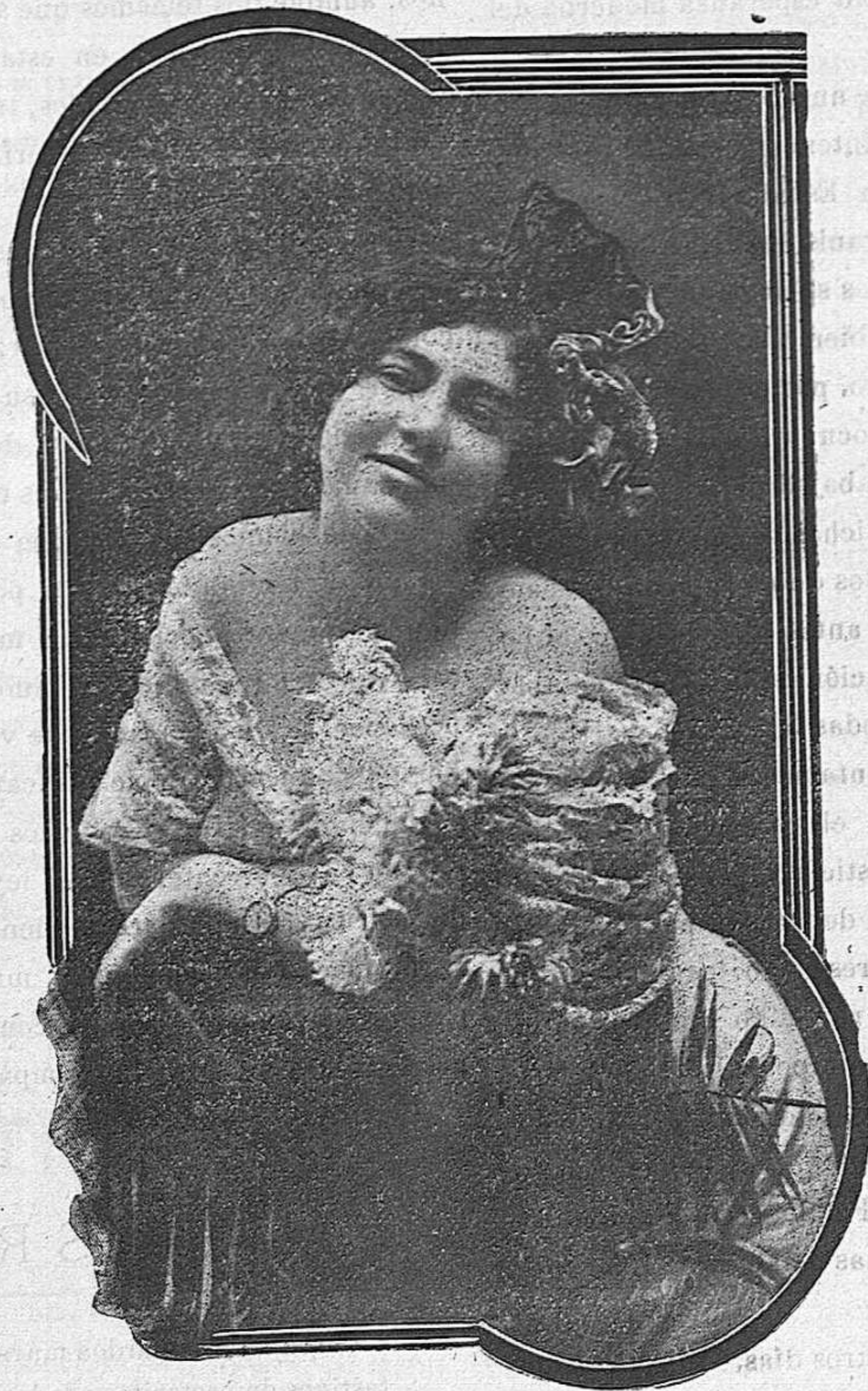
SARA DEL MONTE, hermosa cupletista y canzonetista.