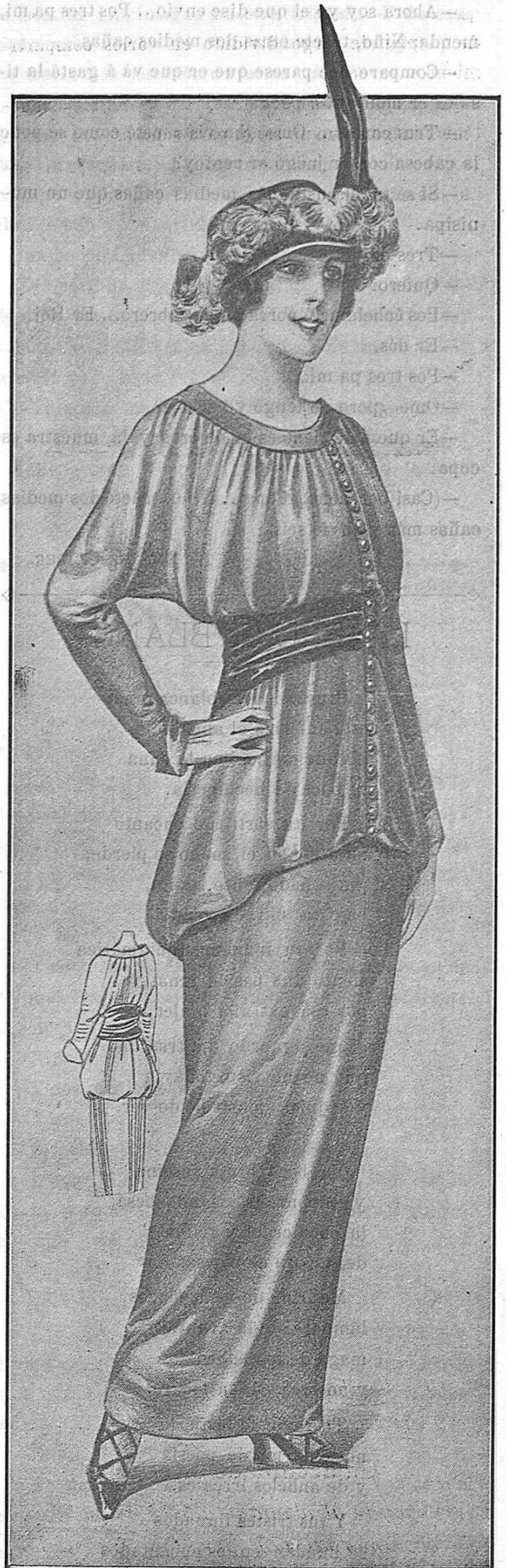
Vestido de primavera. Se confecciona en popelín oliva, con la falda panier, con ancha faja negra y botones novedad.