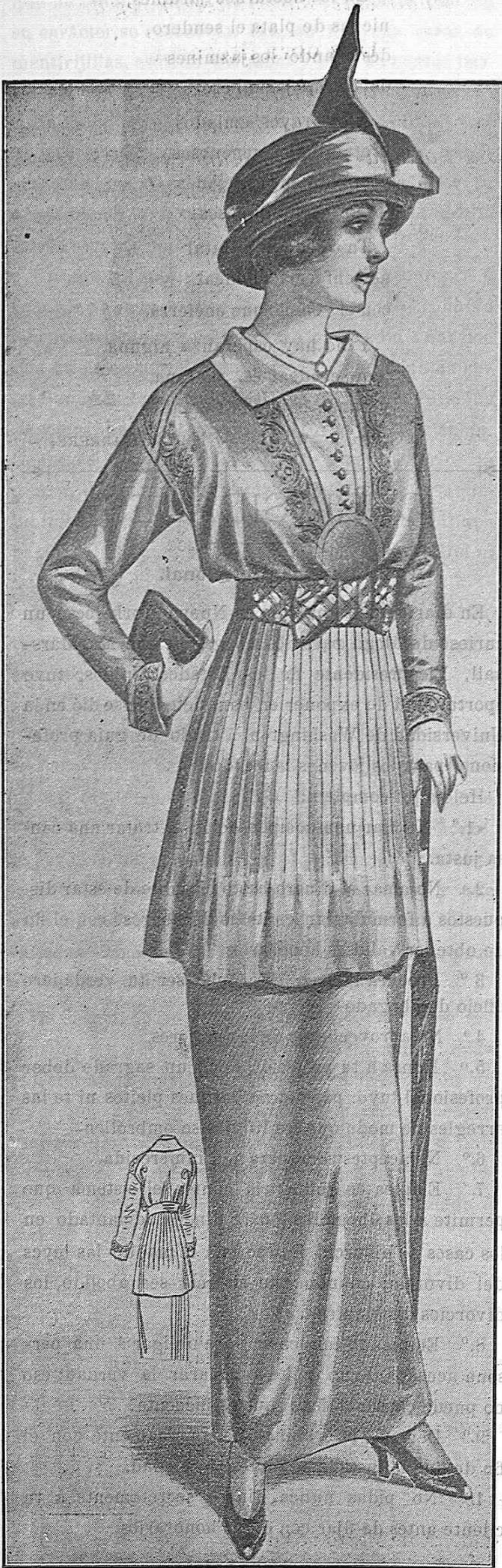
Trajecito en lanilla chamons. Falda lisa; sobrefalda con torcitas ciñéndola; blusa con bordados de seda y cinturón escocés.