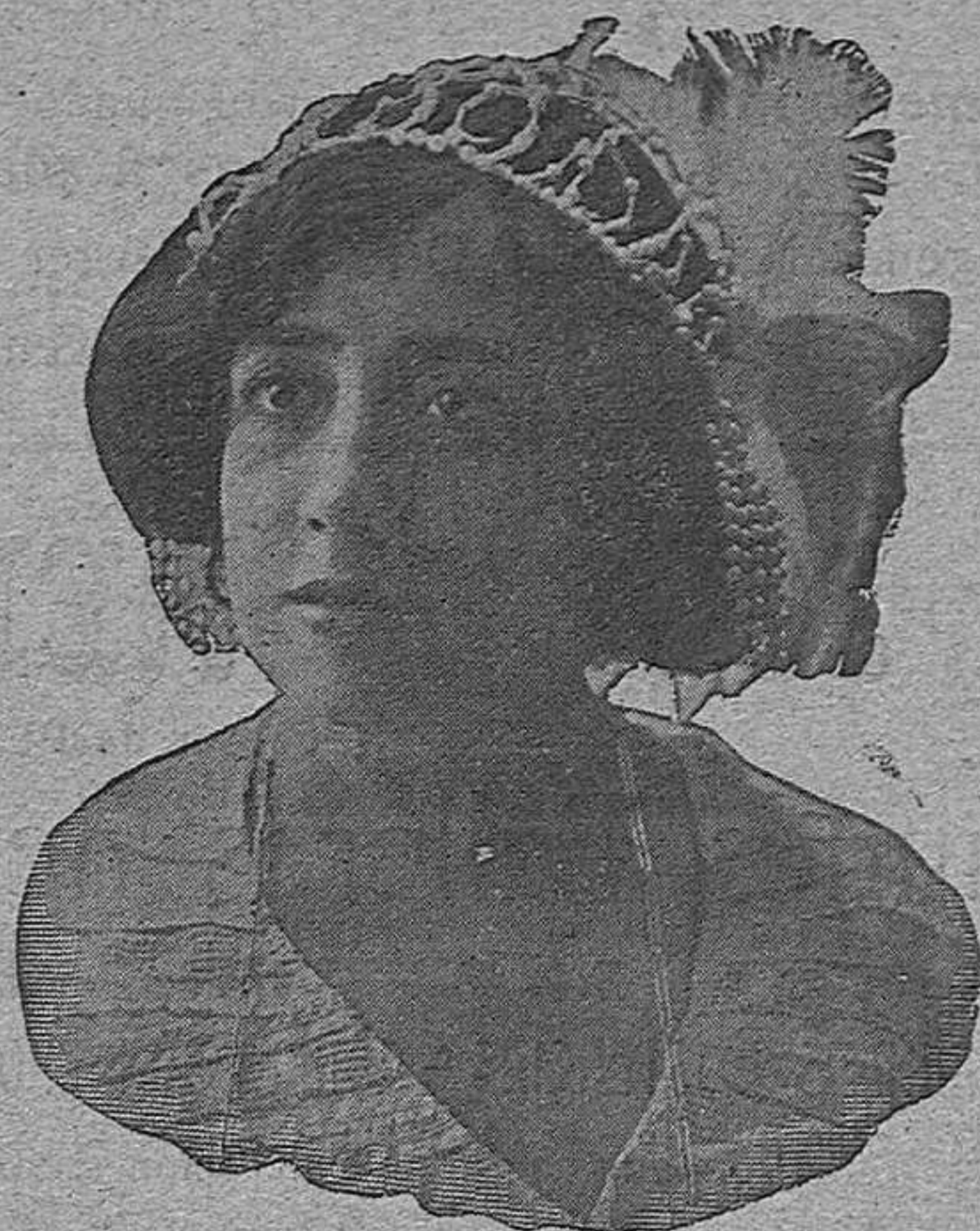
El notable dueto LOS WIWESKIS