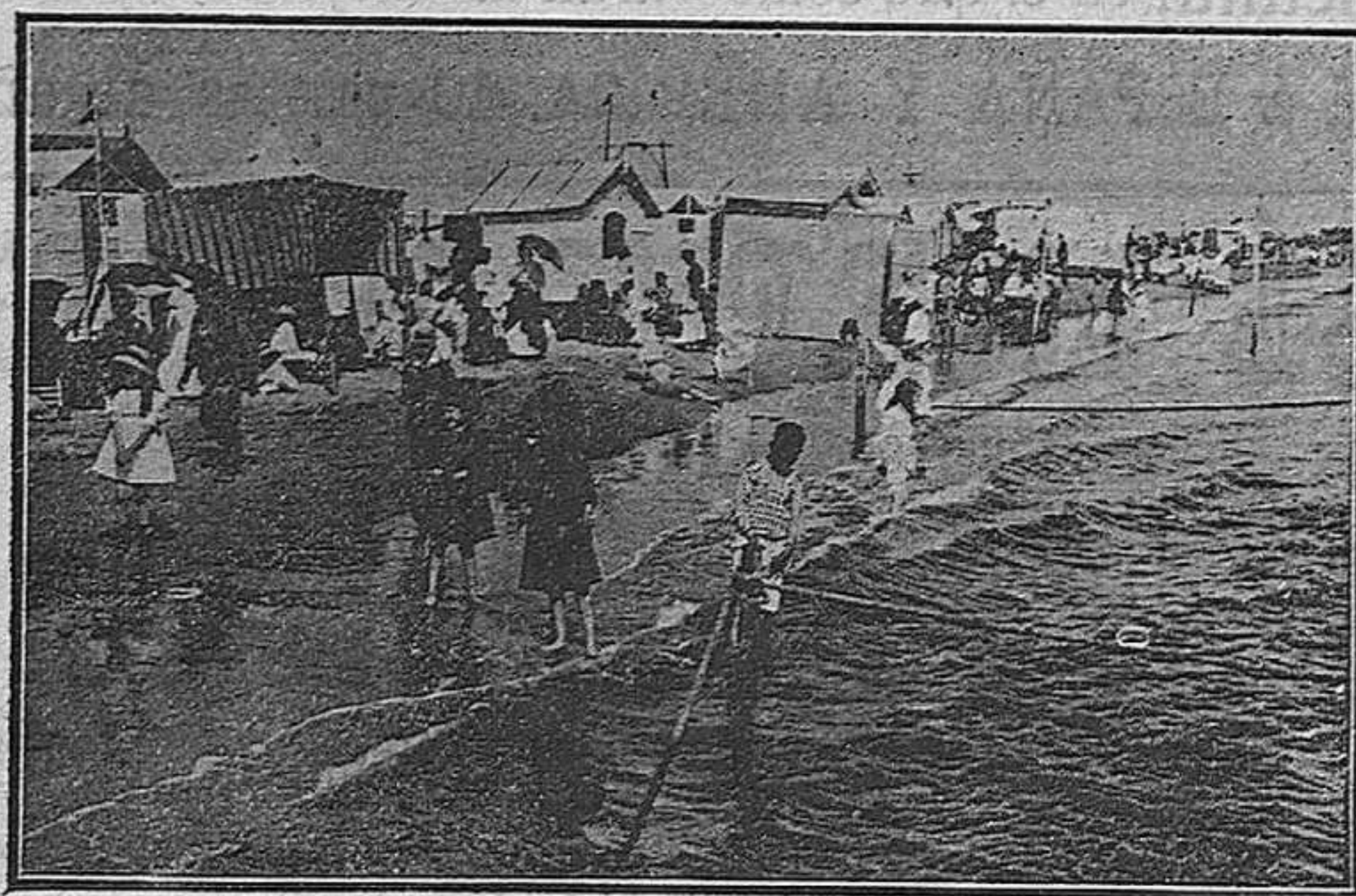
PLAYA DEL PUERTO SANTA MARÍA