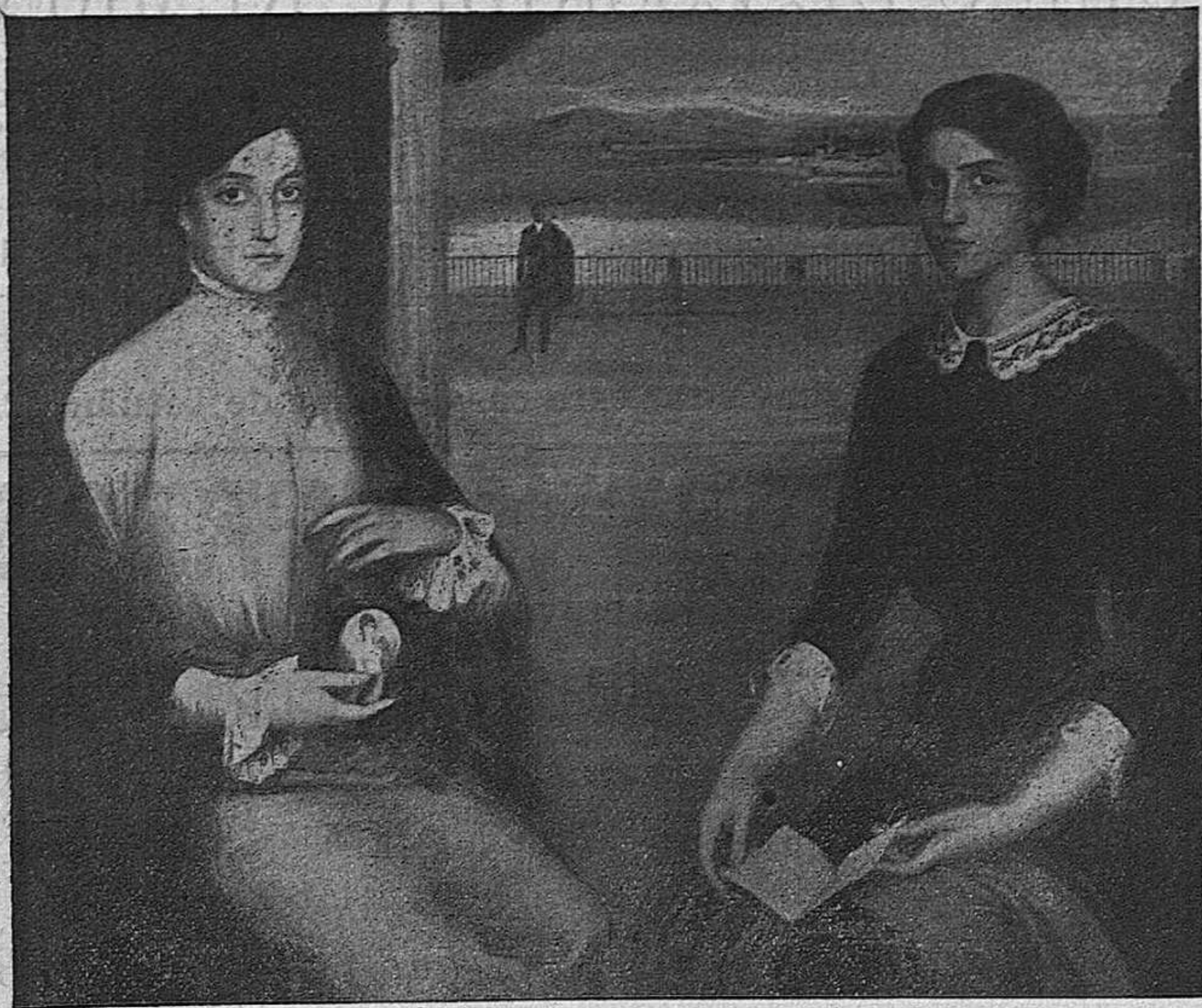
Cuadro del laureado pintor Julio Romero de Torres, adquirido por el Ayuntamiento de Córdoba.