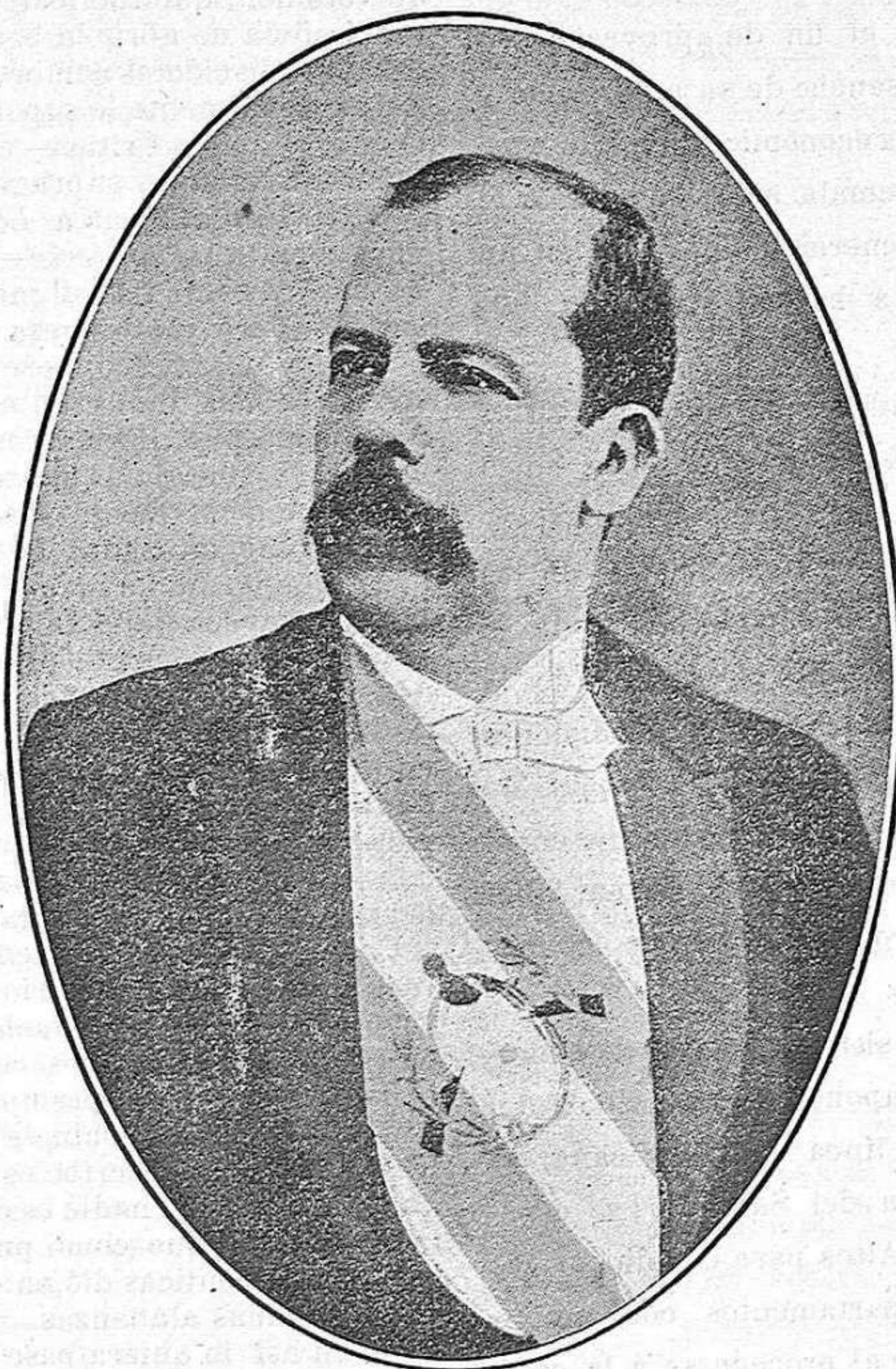
Excmo. Sr. Dr. D. Manuel Estrada Cabrera.

»Las diversas cuestiones económicas y cuanto afecta al bienestar, al crédito y á la prosperidad nacionales, serán siempre objeto de especialísimo estudio, adoptando con oportunidad y energía las resoluciones que el interés del país reclame, y haciéndolas