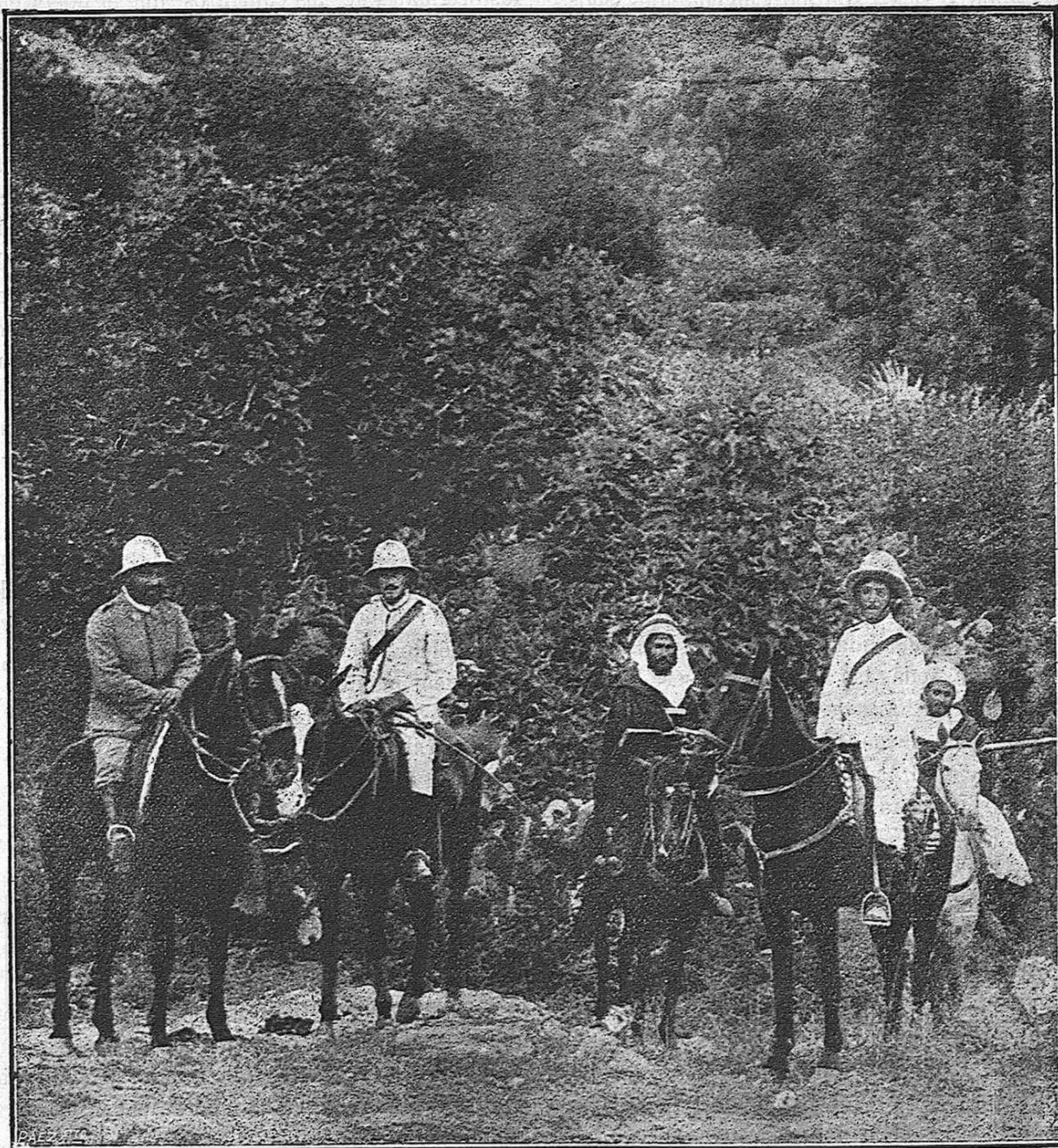
Melilla.—Oficiales españoles practicando un reconocimiento por los alrededores de Zoco el Arba acompañados de la policía indígena