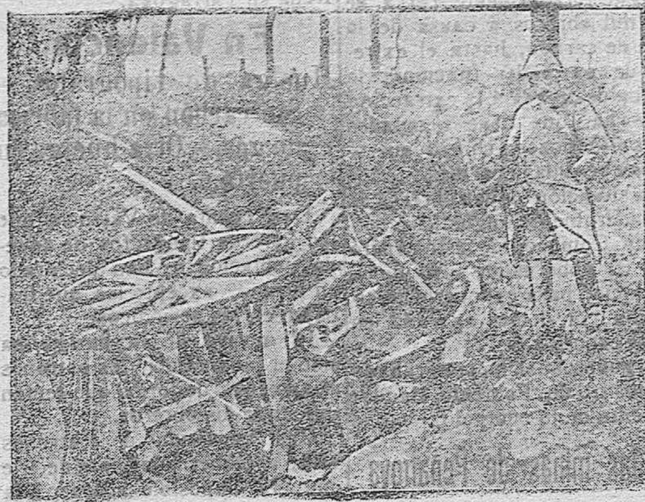
DE LA GUERRA.—Batería alemana destruida.