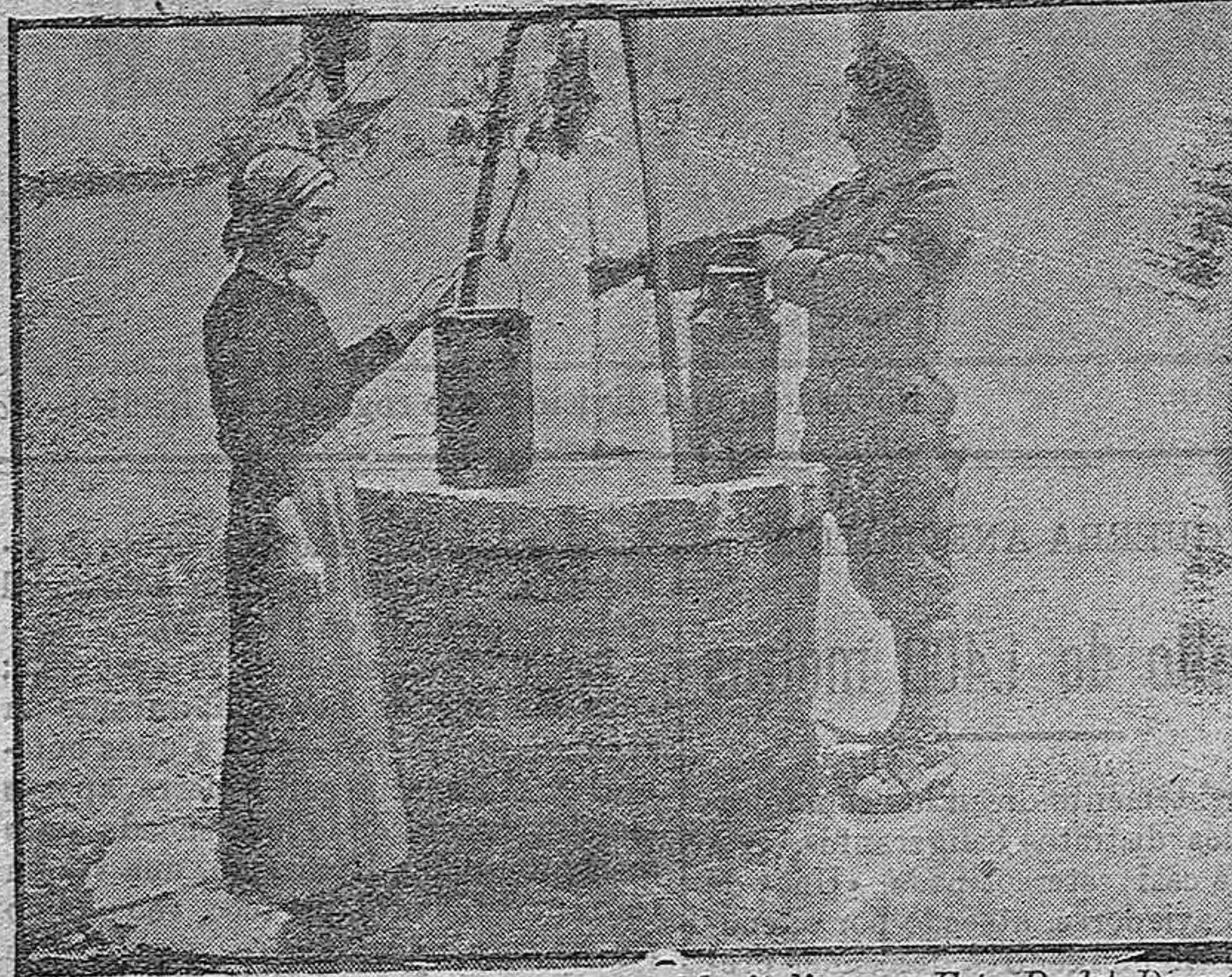
Cazador francés y aldeana en un pueblo italiano.