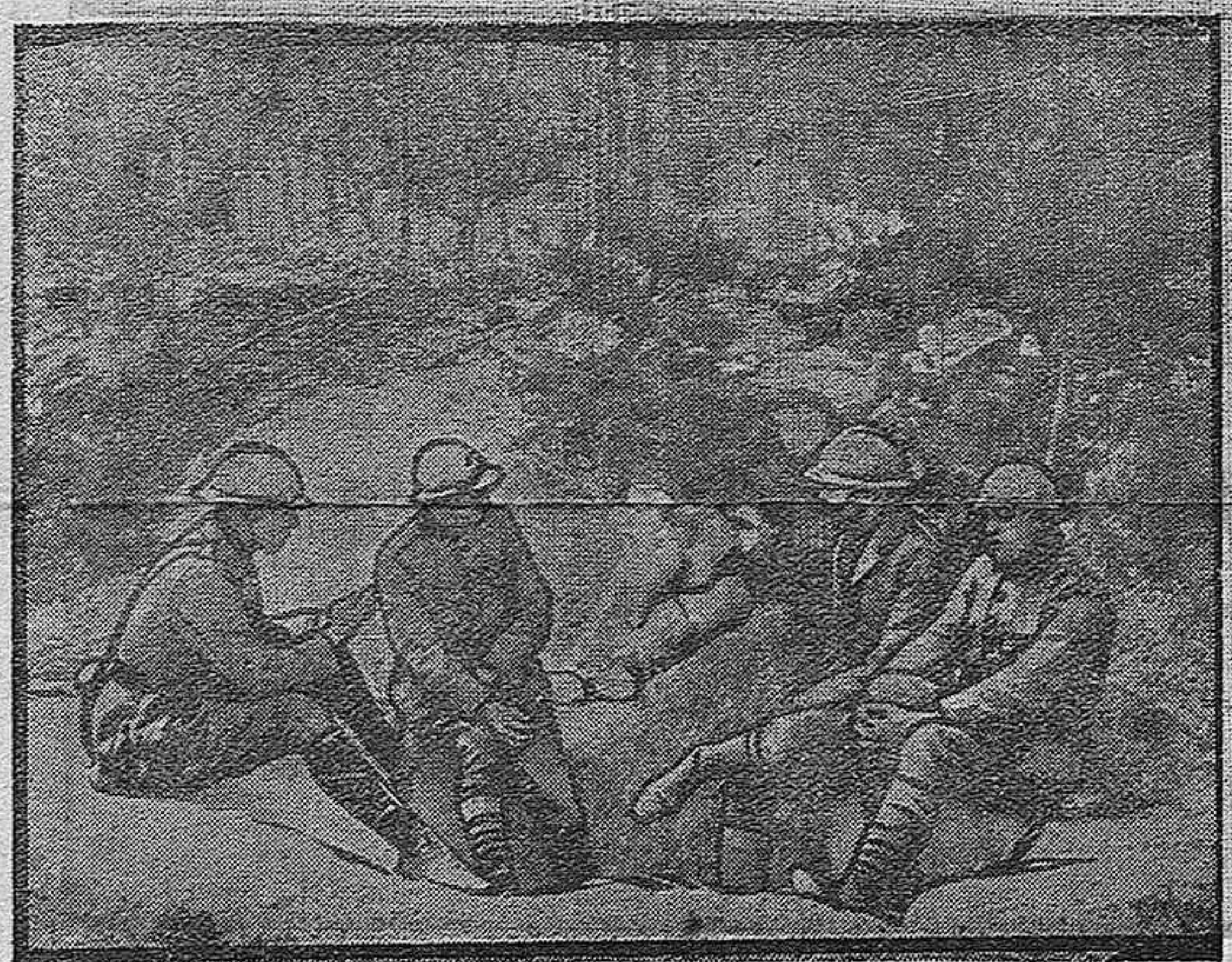
Ambulancias americanas.