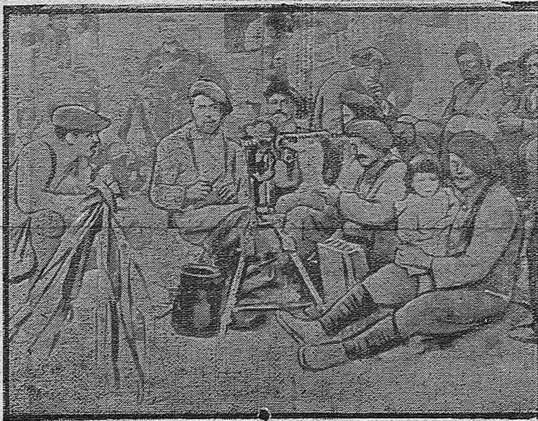
Ametralladoras francesas en Grecia.

Un grano verda recolectado anticipadamente no germina porque los cotile-