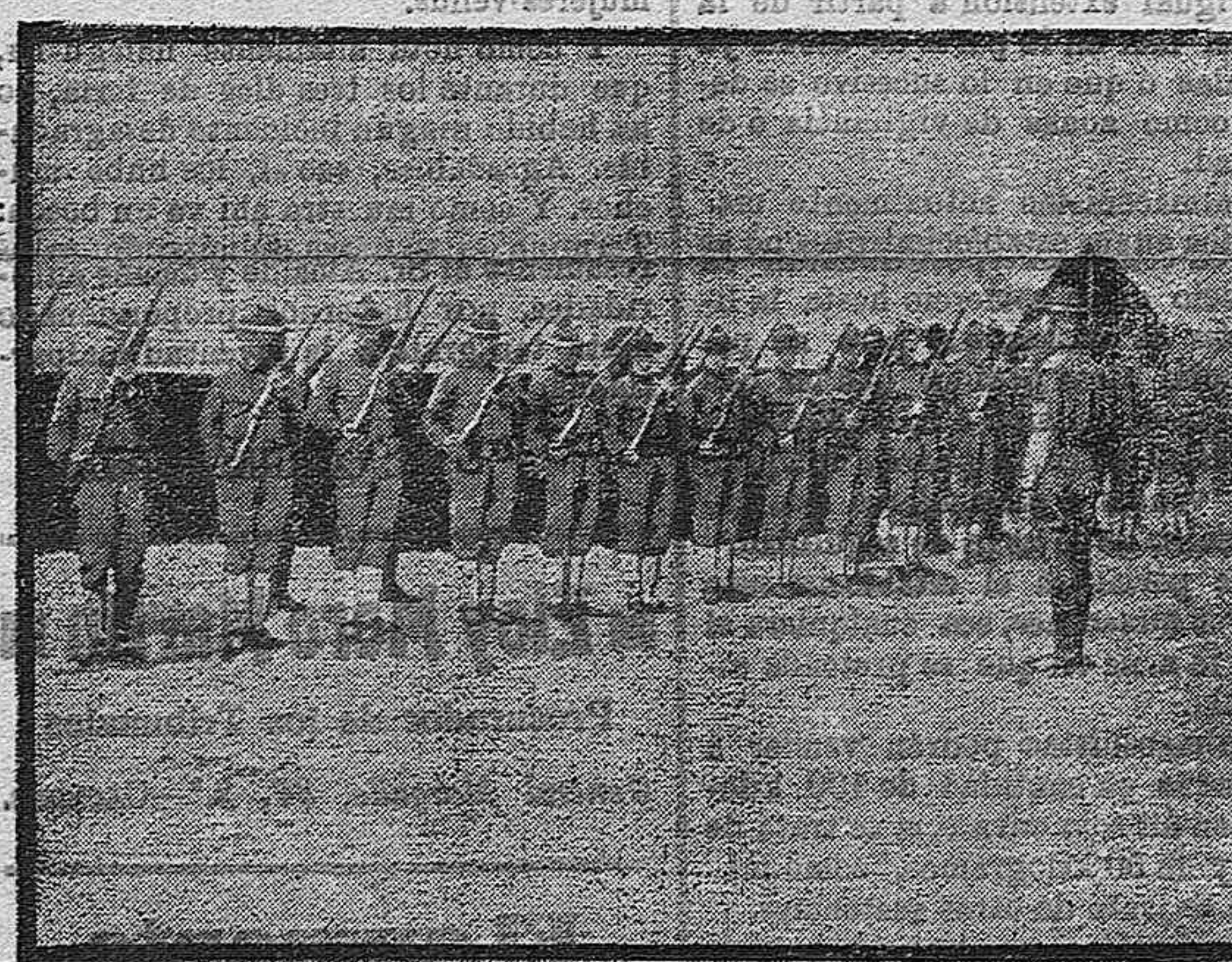
Americanos haciendo el ejercicio.

Yo, al más misero de tus hijos, me atrevo á increpar hoy, sin renegar de tí, que eres mi madre, pero odiando en tí, lo que tienes de abyecto, de cruel y de perdida.