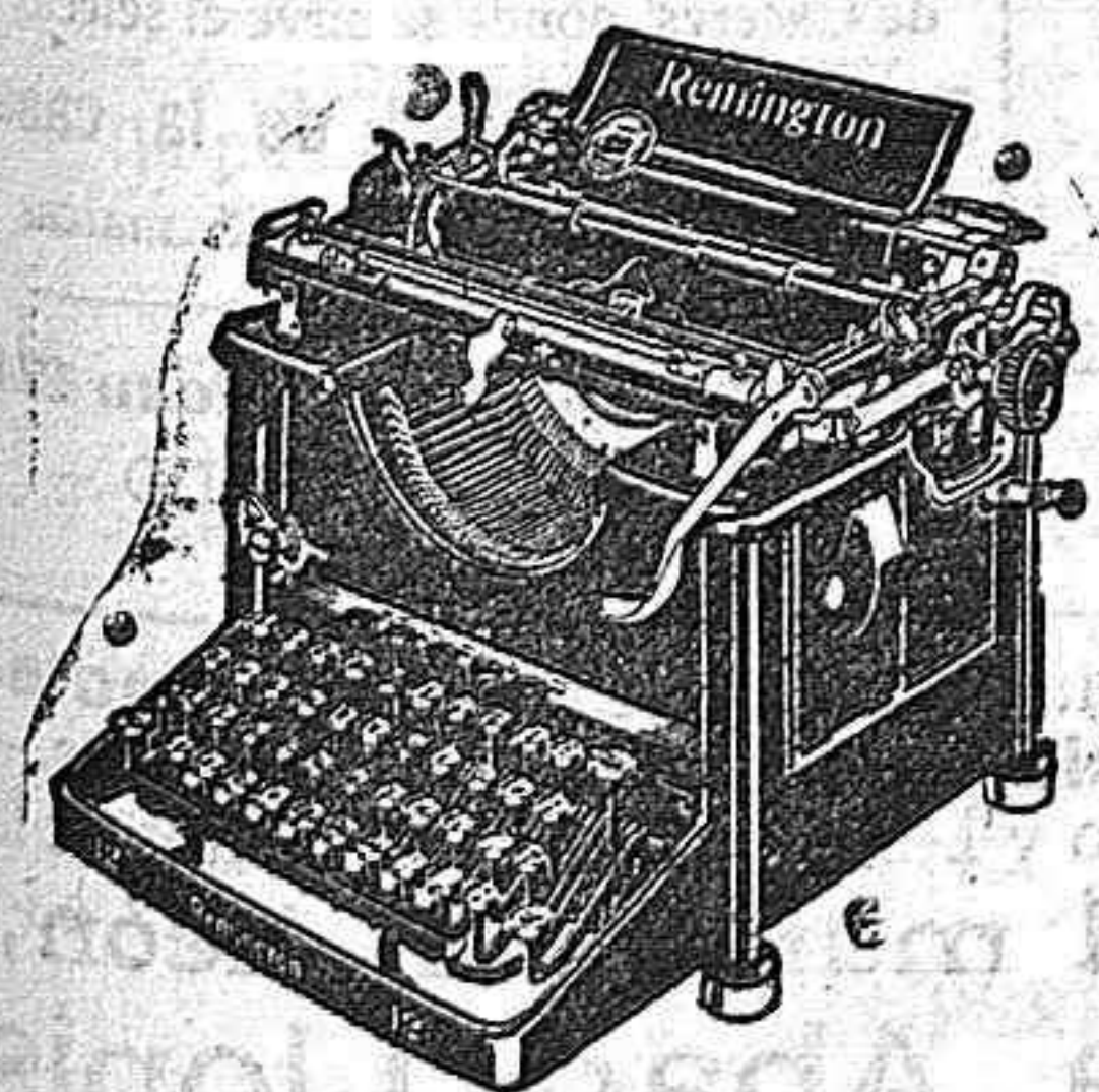
Máquina de funcionamiento silencioso