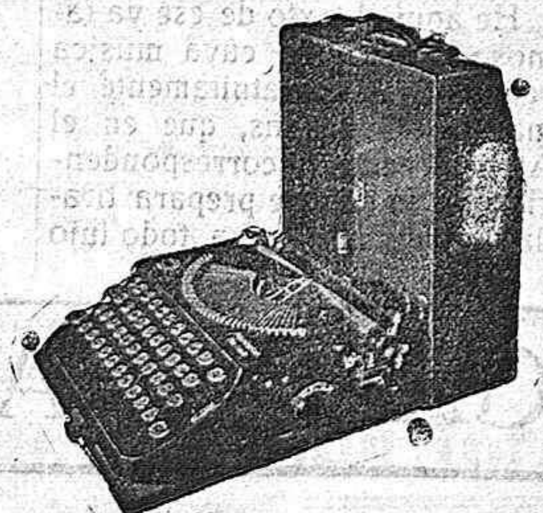
La primera máquina de escribir Portatil con teclado universal