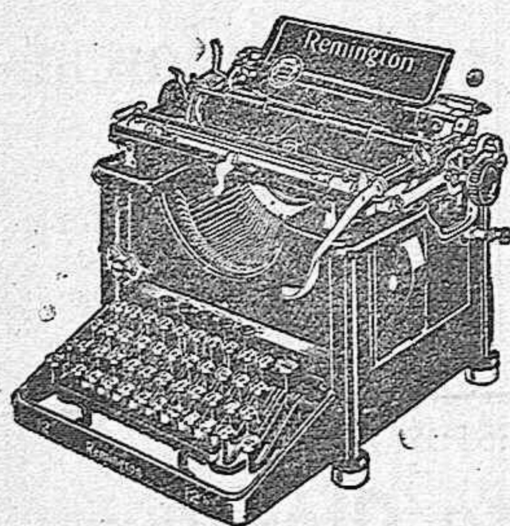
Máquina de funcionamiento silencioso