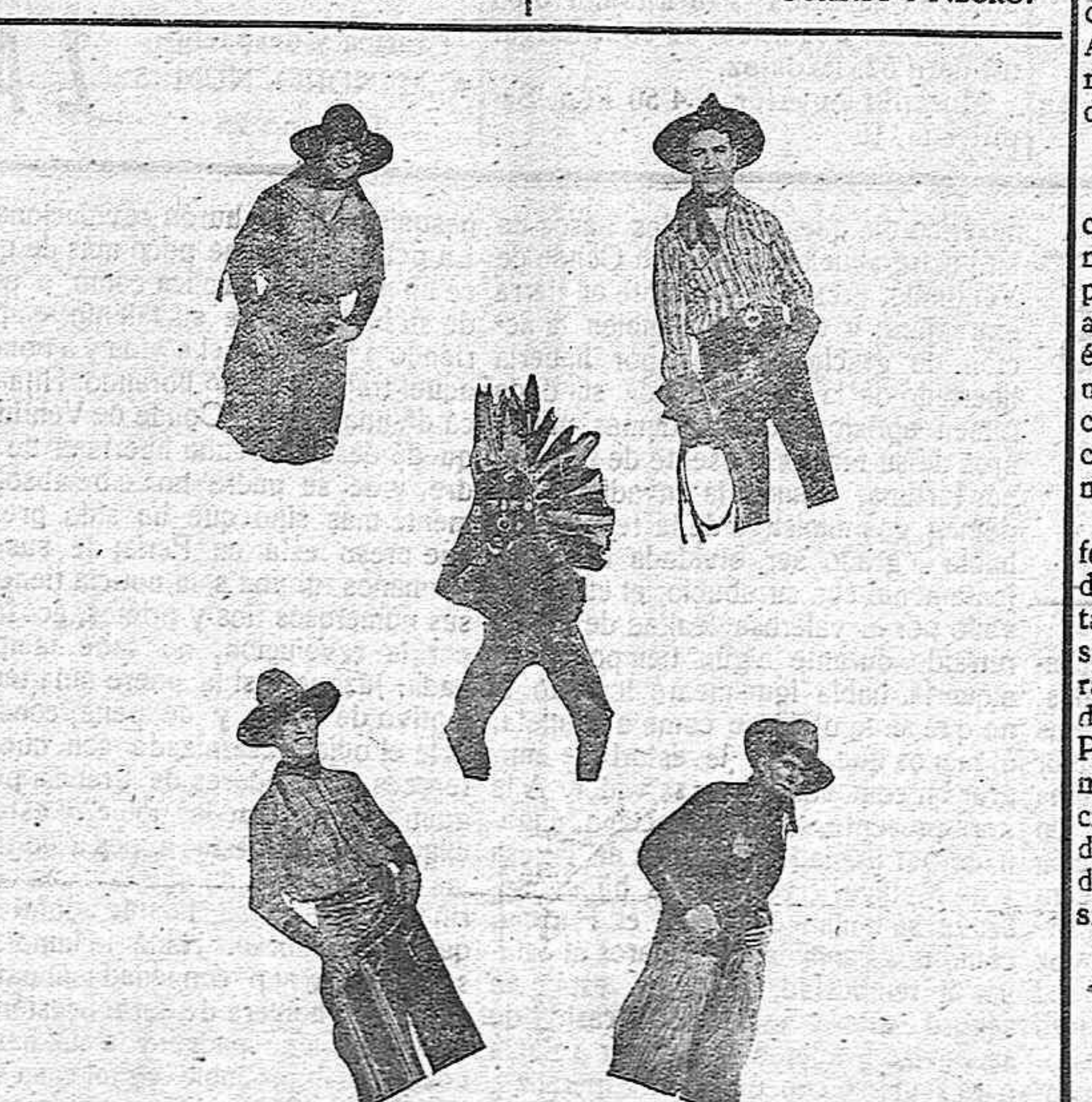
The Famous Rastelli

en San Emiliano (León), pertenecientes a la FUNDACION SIERRA PAMBLEY. Pastos superiores para ganado fino transhumante. Capacidad libre, 5.800 cabezas. Subasta en León, plaza Catedral, 11, el 20 de julio próximo, diez mañana. Descripción, tasación y condiciones, manifiestos en JUNTA PROVINCIAL DE BENEFICENCIA en Badajoz.