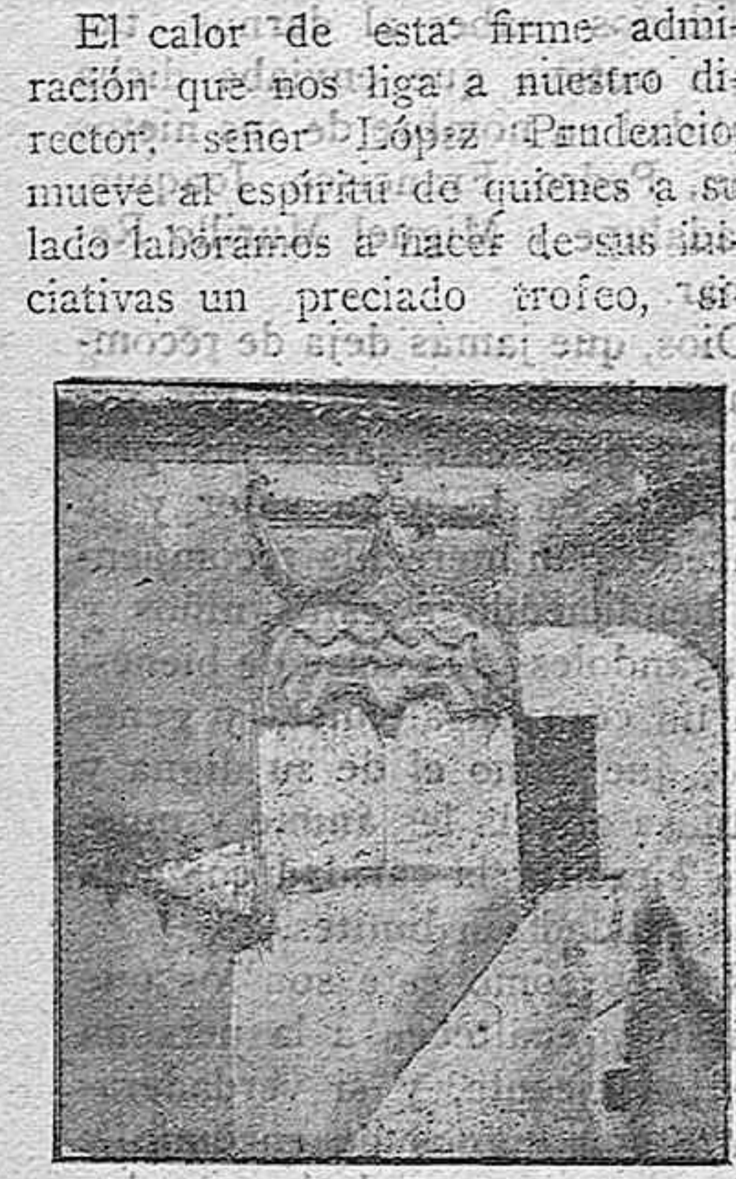
Calle San Atón.—Un ventanal de la supuesta "Casa de la Roma"

Con ocasión del derribo de la cárcel vieja, la pluma brillante de un castizo escritor de nuestra tierra vuelve por los fueros de las cosas de antaño, que tan grato sabor tienen para los que de verdad aman el solar de sus mayores