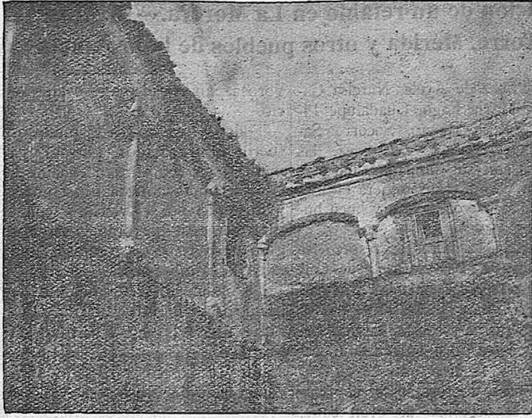
Calle San Atón.—La galería de gada de la "Casa de la Roma"

Ruinosos o bárbaramente deformados aparecen preciados vestigios de lo que fuera Badajoz en los pasados días. Y los temores que todos abrigamos, alcanzan a otros restos que pueden admirar nuestros lectores por los grabados unidos a esta información. Interesa a todos unirnos al noble deseo de que se hagan investigaciones a partir del muro que deja al descubierto el derribo de la cárcel vieja, y tanto interesa que los eruditos—como inspiradores de las autoridades en las grandes ocasiones—salgan a la defensa de esta casa moruna tan modesta en su aspecto, pero tan valiosa en su significación típica. Y no dejen que la ruina haga desaparecer, en fecha no muy lejana, esa otra casa vecina de la ermita