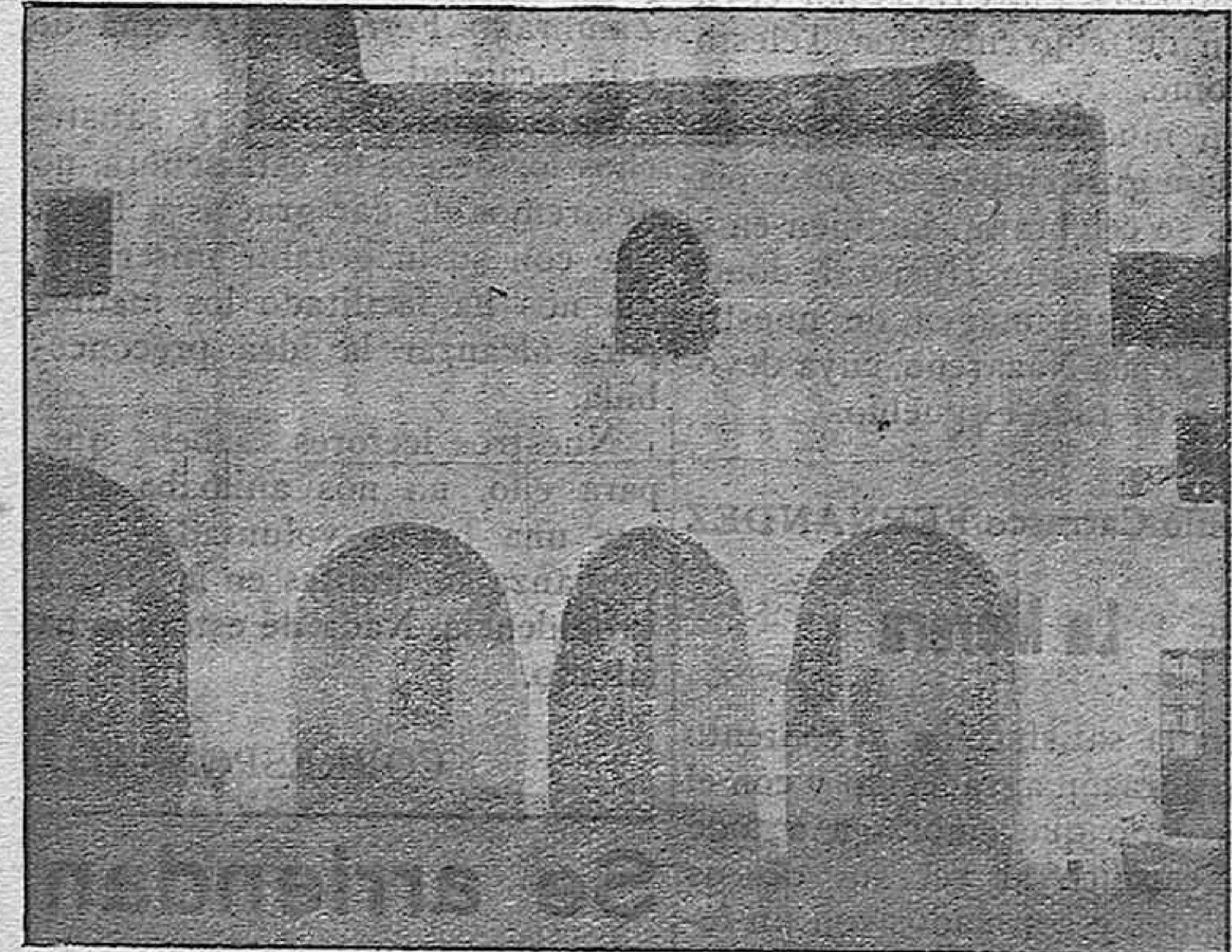
RINCONES DE BADAJOZ Plaza Alta.—Linda casa de la más pura traza musulmana.