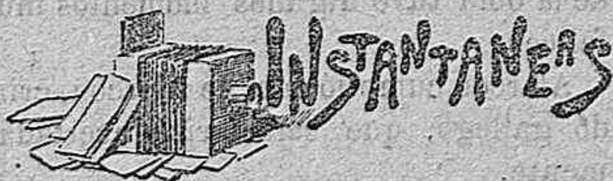
Efectos de la sesión.

De un suceso, verdaderamente cómico, se ha hablado hoy.