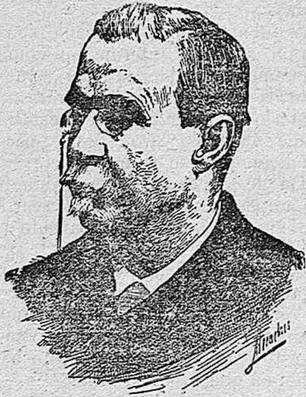
1. Cánovas del Castillo

—De los montes... públicos. El partido conservador está en crisis, está como si dijéramos de parto; ¿saldrá a luz un nuevo partido? —¡Qué se yo! Pero presumo que este ha de ser un mal parto. —¿Por qué? —Porque nunca segundos partos fueron buenos. En fin; esta Instantánea va resultando muy disidente, es decir, muy larga, y la termino presentando a V. la vera efigie del presidente