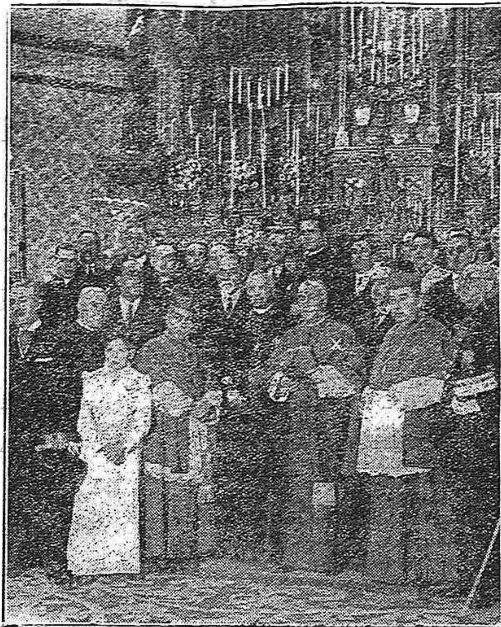
MADRID. — EN LA IGLESIA DE LA CONCEPCION. — El nuevo obispo de Pamplona, don Tomás Muniz (X), al terminar el solemne acto de su consagración.

Terminado el anterior asunto y aprovechando la reunión de los agricultores, el señor Villalobos dió cuenta de la situación de la cobranza del impuesto de pesas y medidas.