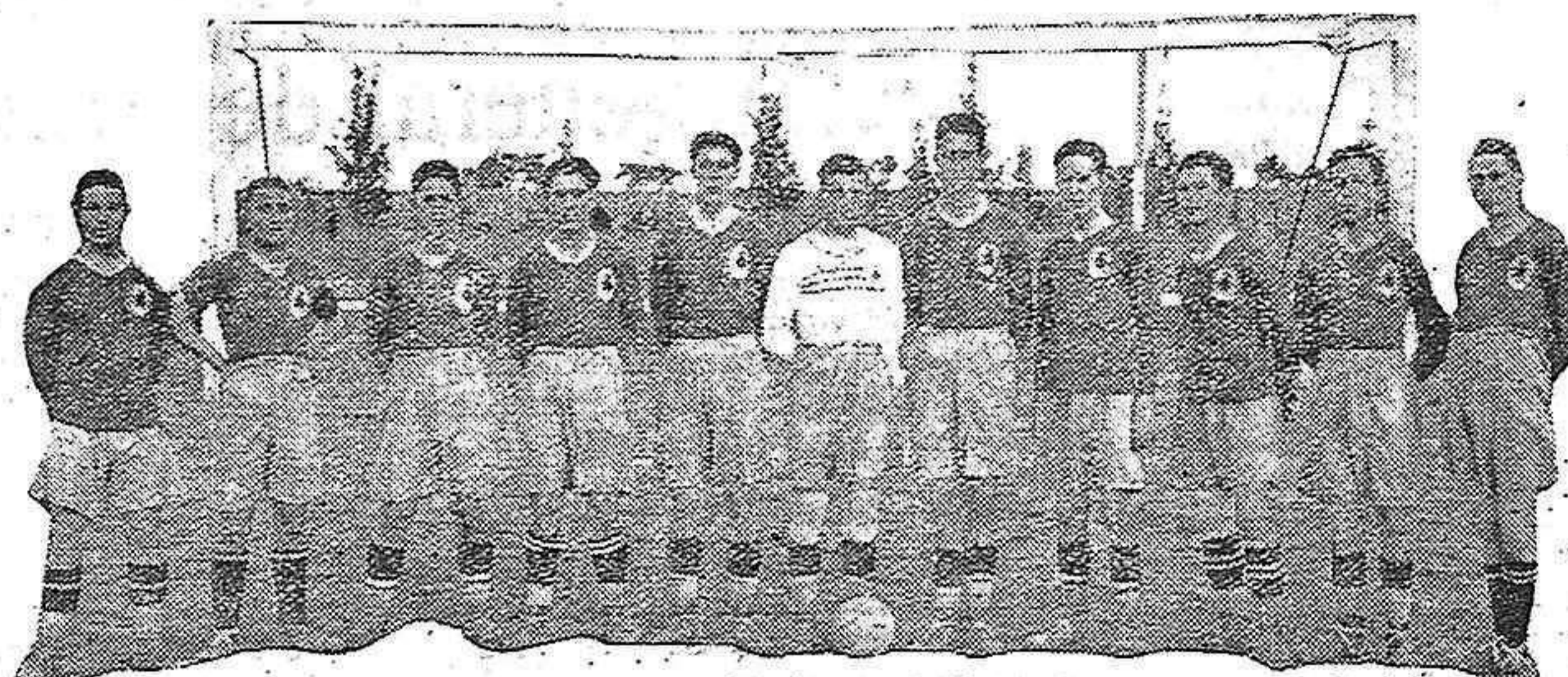
El equipo de fútbol del Regimiento de Gravelinas en el que figuran varios conocidos elementos y que a medida que van jugando partidos, evidencian una excelente clase, prometiendo ser un apreciable conjunto

Jugó luego contra Francia, y el árbitro holandés Geyl fué el encargado de dar a Francia una victoria que pudo muy bien ser un empate si el mencionado árbitro no hubiese anulado el goal legalmente obtenido por España. Luego, finalmente, ante un