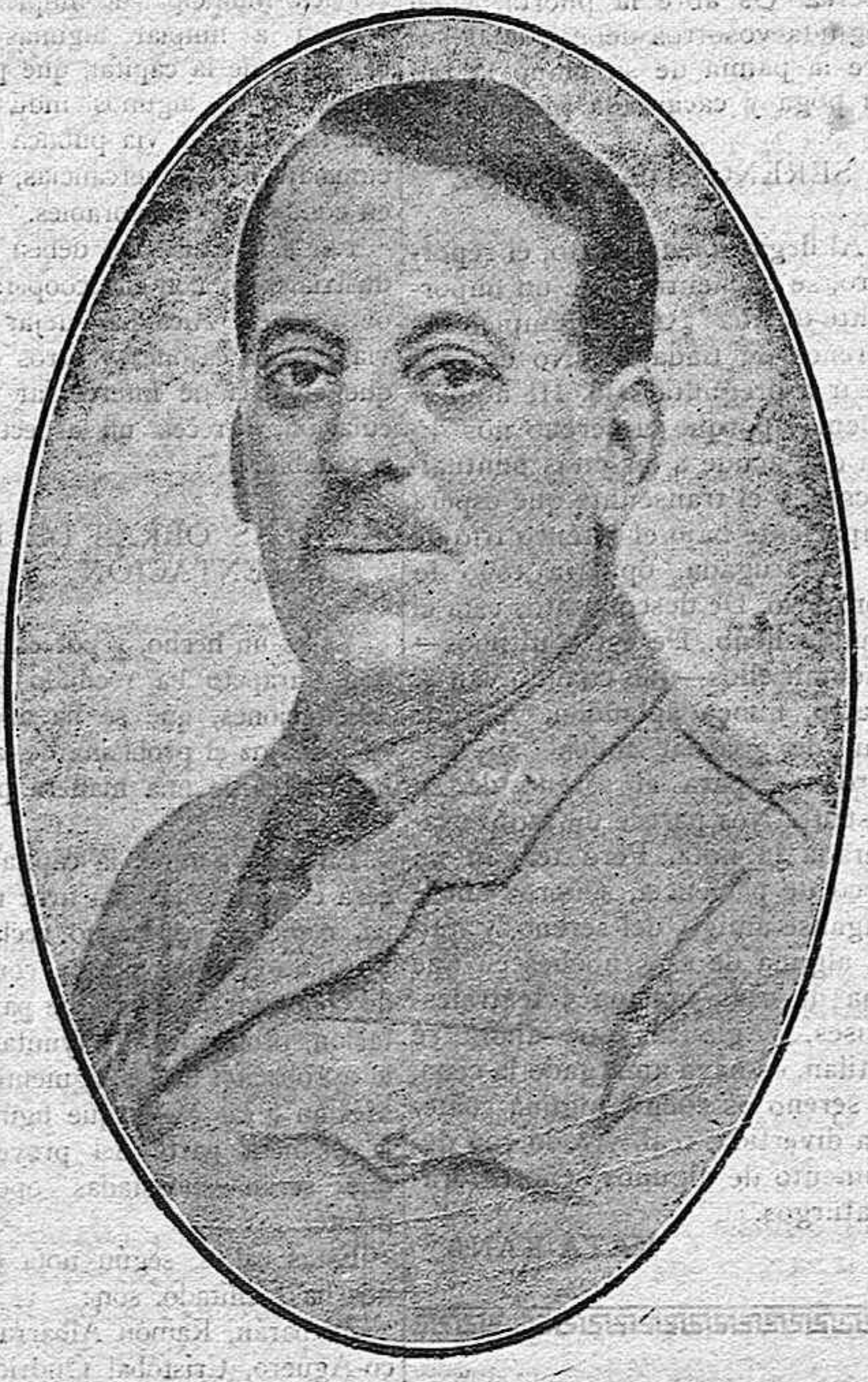
Excelentísimo señor teniente general, don José Sanjurjo Sacanell, director general de la Guardia civil

Don Segismundo Moret ha definido el por qué es ingémito el bandolerismo en nuestra raza, y así dice: "Desde la más remota antigüedad, desde los tiempos del gran historiador Justiniano, ya se aprestaba y conocía nuestro carácter nacional con la más sorprendente exactitud, cuando decía: El cuerpo del español es tan duro y sufrido para el hambre y la fatiga, como su corazón está siempre dispuesto a la muerte. Todos son rigurosamente sobrios, prefiriendo antes la guerra que el reposo, y si el enemigo les falta fuera, ellos lo buscan dentro." No hay, sin embargo, que tomar la definición del señor Moret en un estricto sentido ideológico. Pero fuerza es reconocer la propensión de nuestra raza española hacia la extravagancia y la aventura, como resultado de un espijismo producido por complejas y misteriosas tendencias atávicas. Y hasta en la historia del bandolerismo español no faltan bandidos