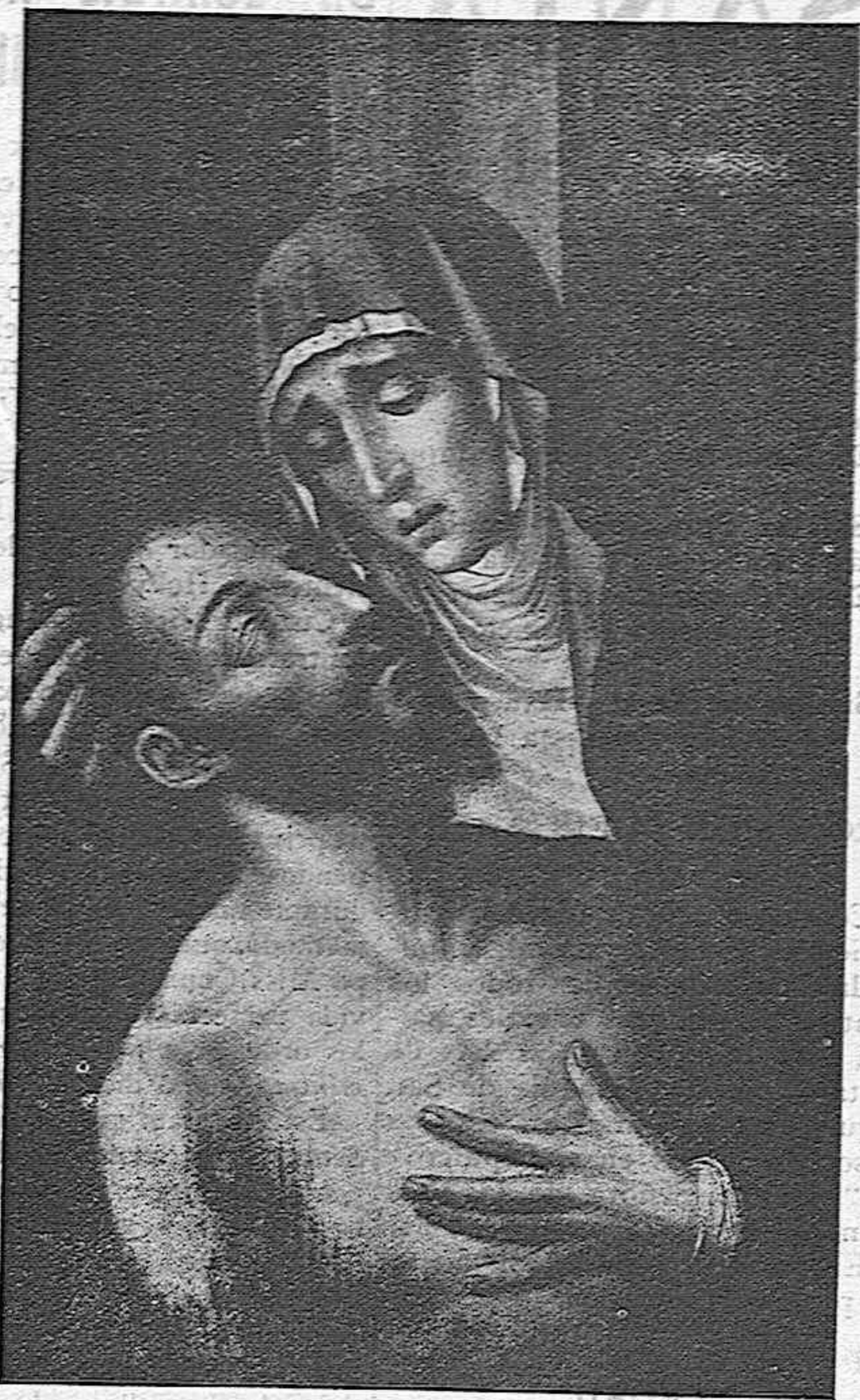
LA VIRGEN DEL MAYOR DOLOR.—(Revista del Centro de Estudios Extremeños)