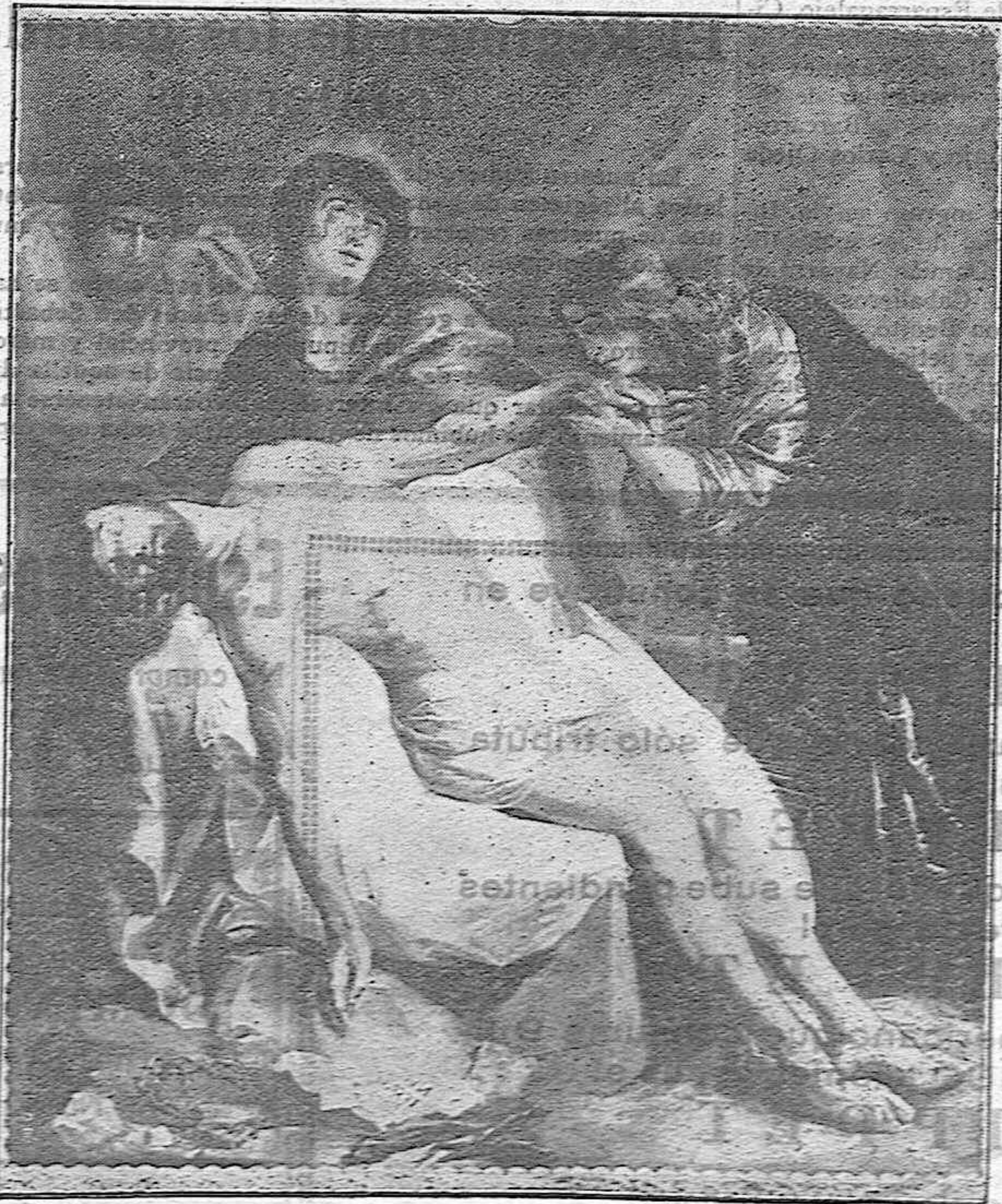
LA PIEDAD.—Lienzo de Pedro Pablo Rubens, existente en el Museo Nacional del Prado, Madrid.

Reguemos nosotros esa losa con abundantes lágrimas como antes el escritor escéptico Pierre Loti, y al depositar en ella un ardiente beso repetamos las palabras del gran Lacordaire: "Hubo un hombre y el amor guardó su tumba, su sepulcro no fué solamente glorioso, como dijo el Profeta, sino que fué también amado; hubo un Hombre y aunque desapareció, gran parte de la Humanidad le sigue en todos los lugares de su antigua peregrinación mortal, lo buscan en las orillas de los lagos, en las rodillas de su madre, en lo alto de las montañas, en los senderos de los valles, a la sombra de los olivos, en el secreto de los desiertos; hubo un Hombre crucificado, y a este Hombre millones de adoradores lo desclavan de su cruz cada día y poniéndose de rodillas e inclinándose cuanto pueden, sin vergüenza, sin respetos humanos, besan con increíble ardor sus pies ensangrentados. Hubo un Hombre en fin y él sólo fundó el amor sobre la tierra, y éste Hombre sois vos ¡Oh Jesús!"