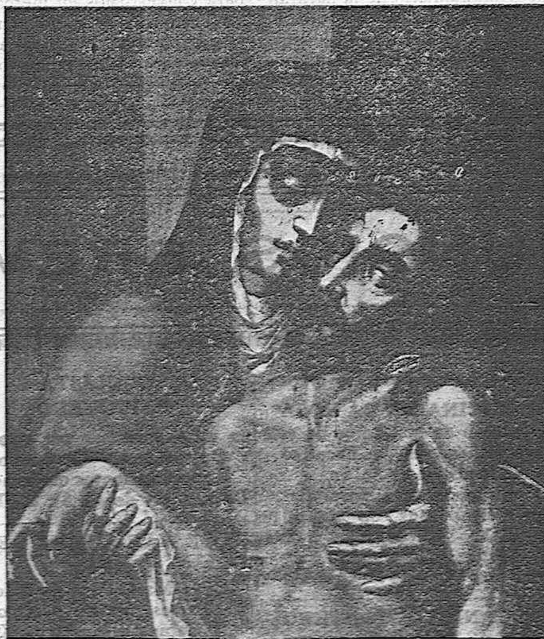
PIEDAD.—(Revista del Centro de Estudios Extremeños)