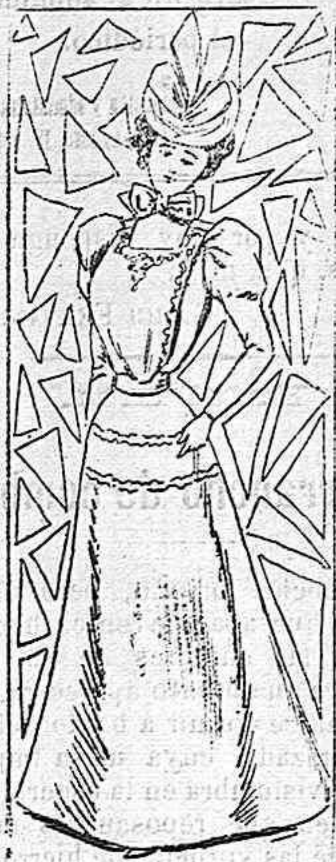
Trajes para campo.

Modelos exclusivos para nuestras lectoras, de los grandes almacenes de EL SIGLO, Barcelona (1).