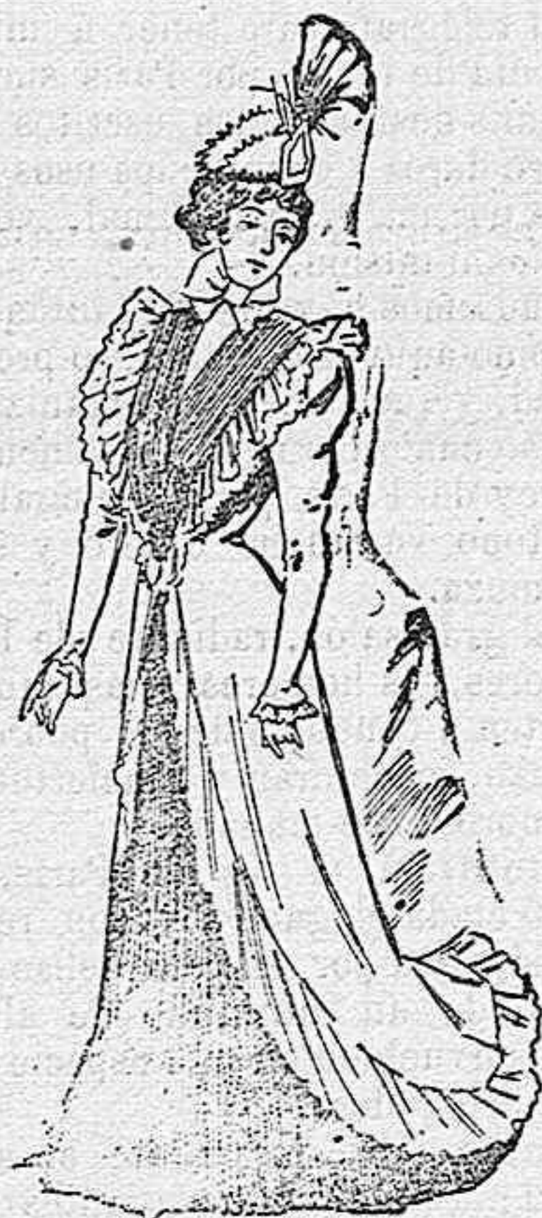
Traje para bodas.

Modelos exclusivos para nuestras lectoras, de los grandes almacenes de EL SIGLO, Barcelona (1).