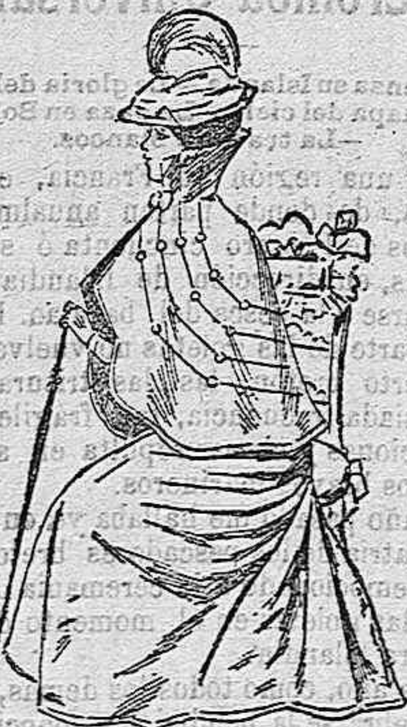
Exclavina para entretiempo.

Modelos exclusivos para nuestras lectoras, de los grandes almacenes de EL SIGLO, Barcelona (1).