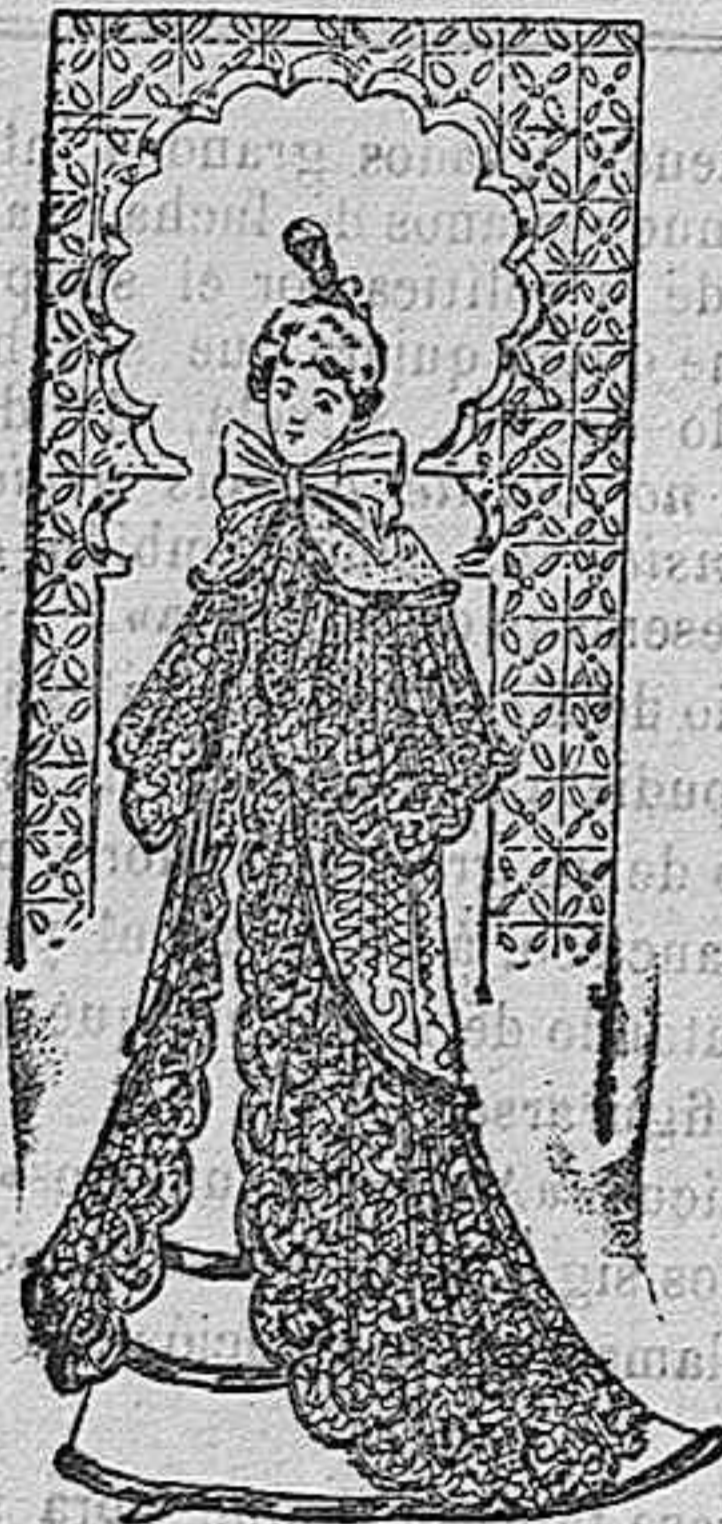
Abrigo para salida de teatro.

Modelos exclusivos para nuestras lectoras, de los grandes almacenes de EL SIGLO, Barcelona (I).