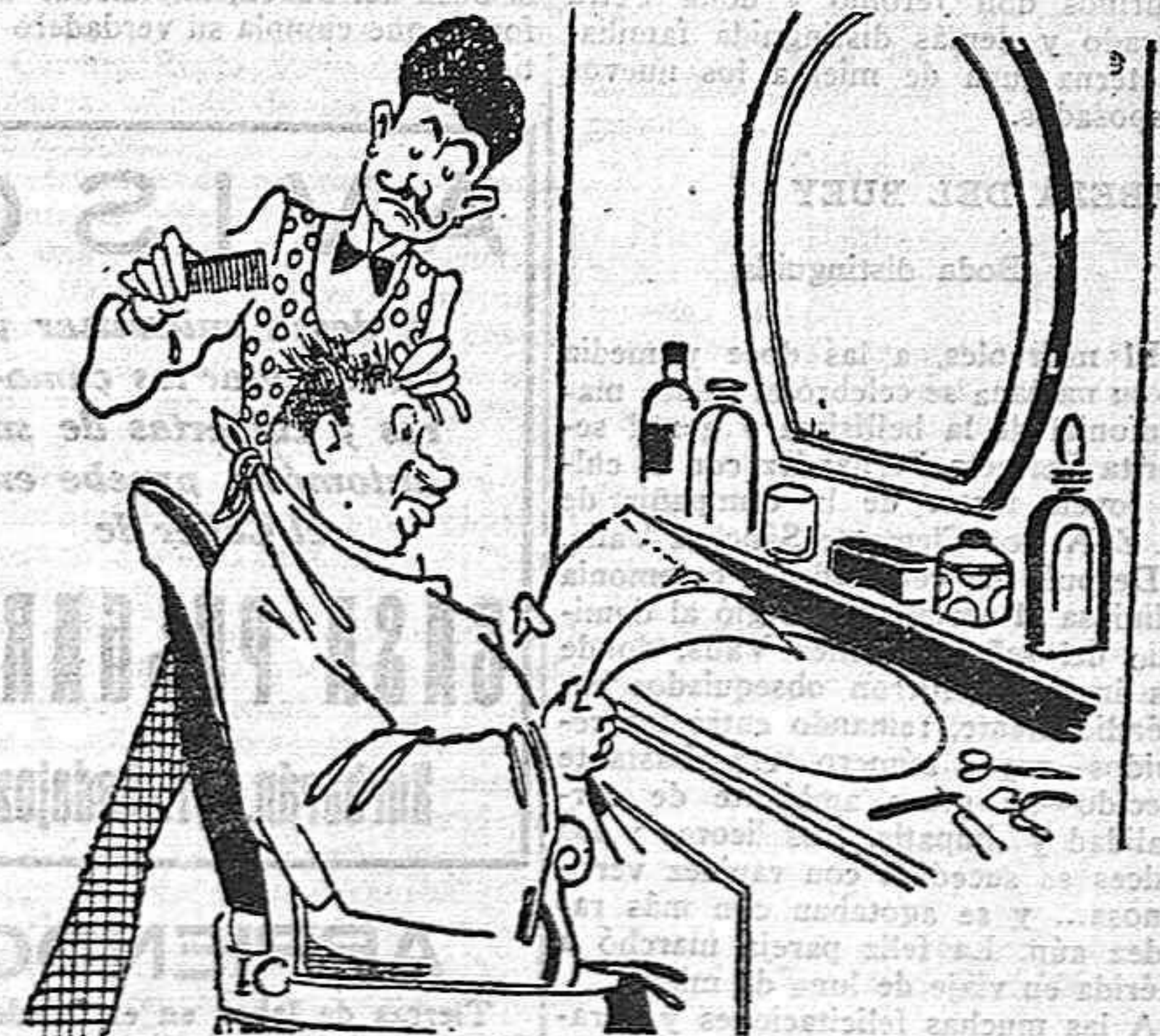
El peluquero.—¿Cómo hace usted la raya? El cocinero.—¿La raya? Con manteca, bien frita.