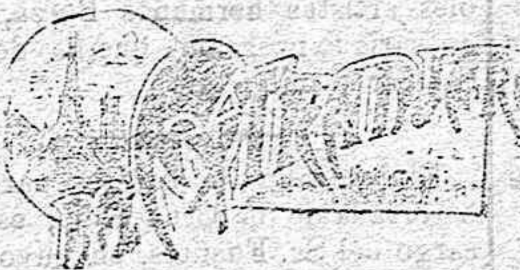
(DE NUESTRO SERVICIO ESPECIAL)

Este juego estuvo muy en boga en Francia hace cosa de un siglo.