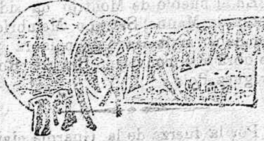
(DE NUESTRO SERVICIO ESPECIAL)

Para animales que se destinan á grandes trabajos como caballos y para los bueyes de engorde, bastan tres kilogramos diarios y una media arroba de paja de trigo cortada y media arroba, de heno, repartido en dos ó tres piensos. Para las vacas lecheras, animales de cerda, becerros etc., la ración varía de uno á dos kilogramos, en relación con su edad y peso y el régimen, á que estén sometidos de otros piensos.