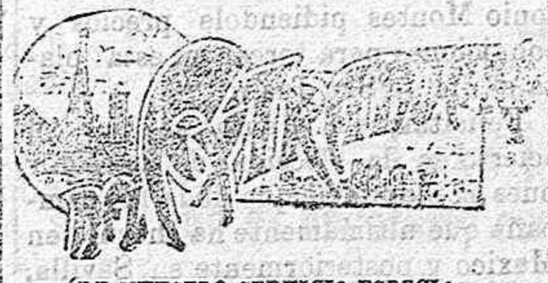
(DE NUESTRO SERVICIO ESPECIAL.)

Los terremotos.—Opiniones de sabios italianos.—Socorros á California.—La salud del Papa.