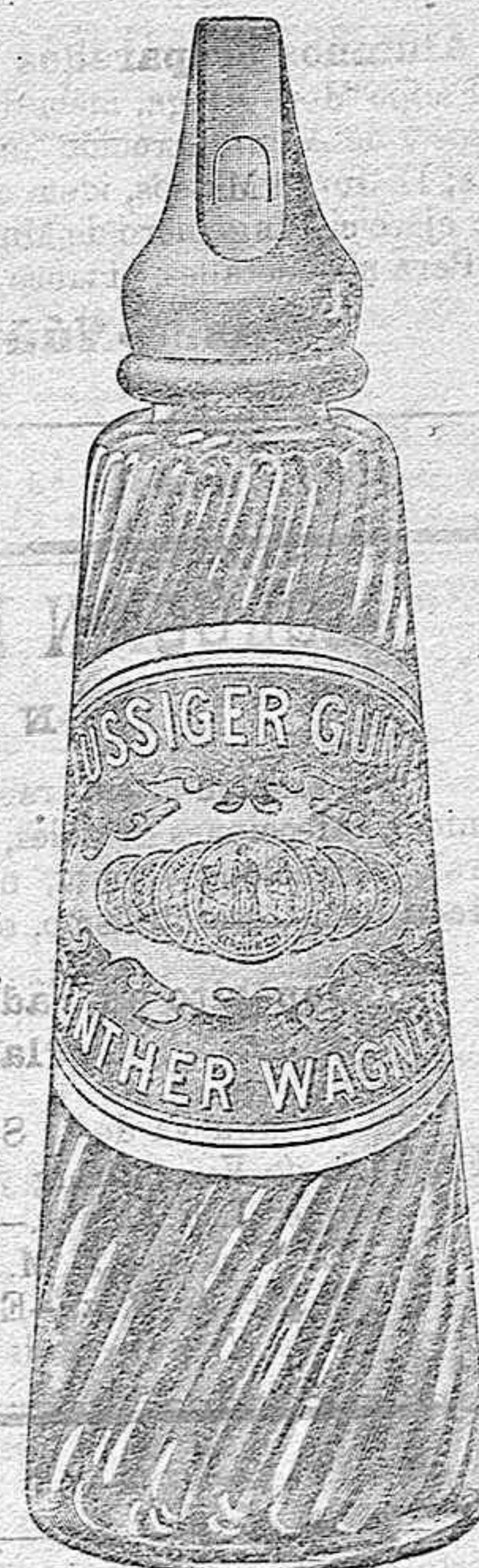
Es la mejor goma para escritorio.