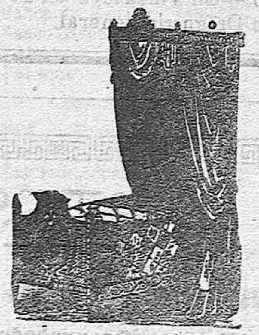
Armaros y silleras