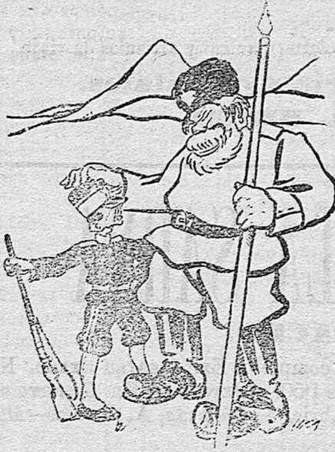
El ruso al japonés.—Antes de la batalla de Yan-Tai te creía salvaje. Hoy voy creyendo que el salvaje soy yo.