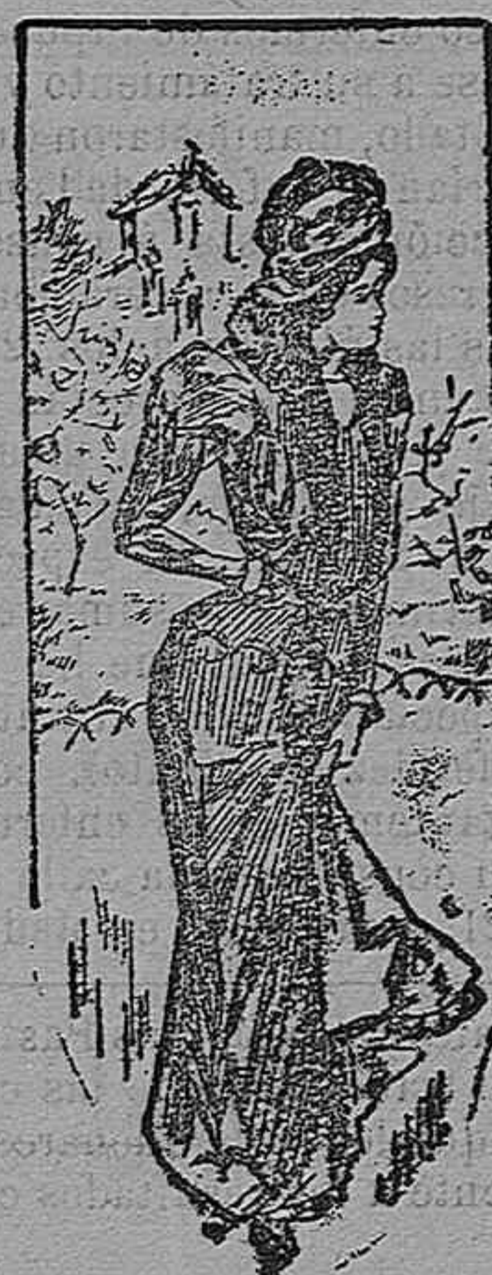
Traje para paseo.

Modelos exclusivos para nuestras lectoras, de los grandes almacenes de EL SIGLO, Barcelona (I).