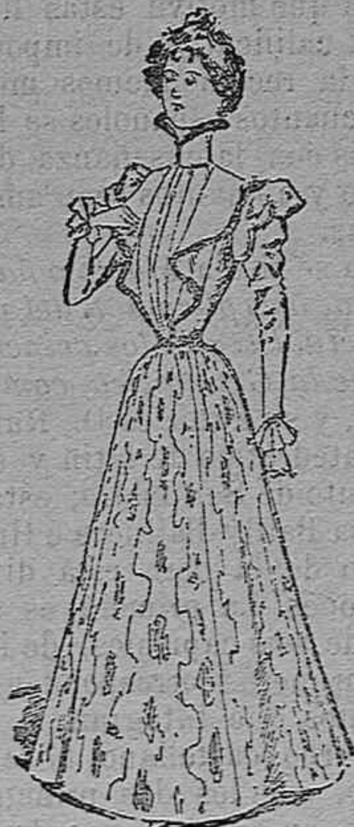
Traje para entretiempo.

Modelos exclusivos para nuestras lectoras, de los grandes almacenes de EL SIGLO, Barcelona (I).