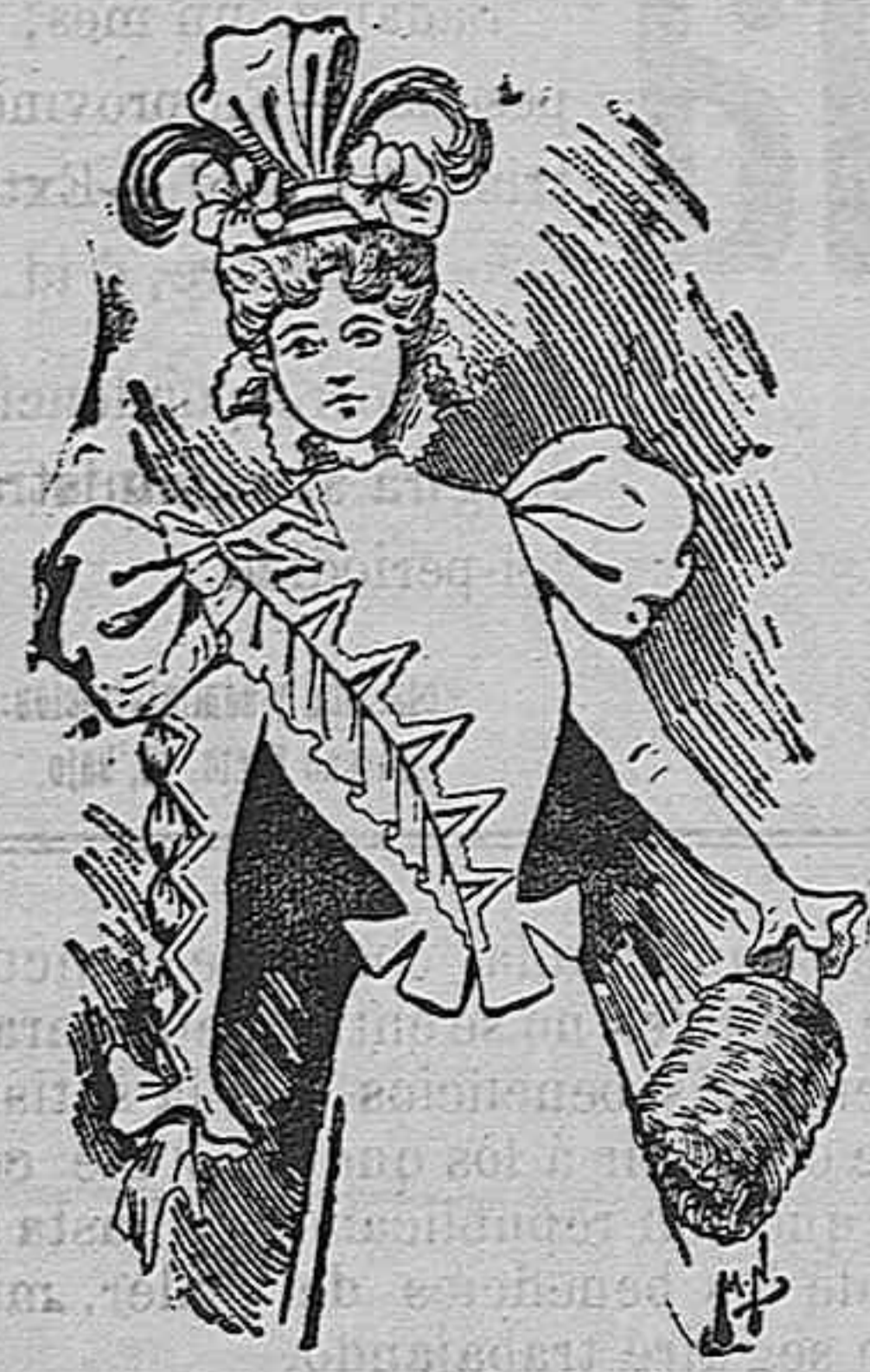
Traje para señorita.

Modelos exclusivos para nuestras lectoras, de los grandes almacenes de EL SIGLO, Barcelona (I).