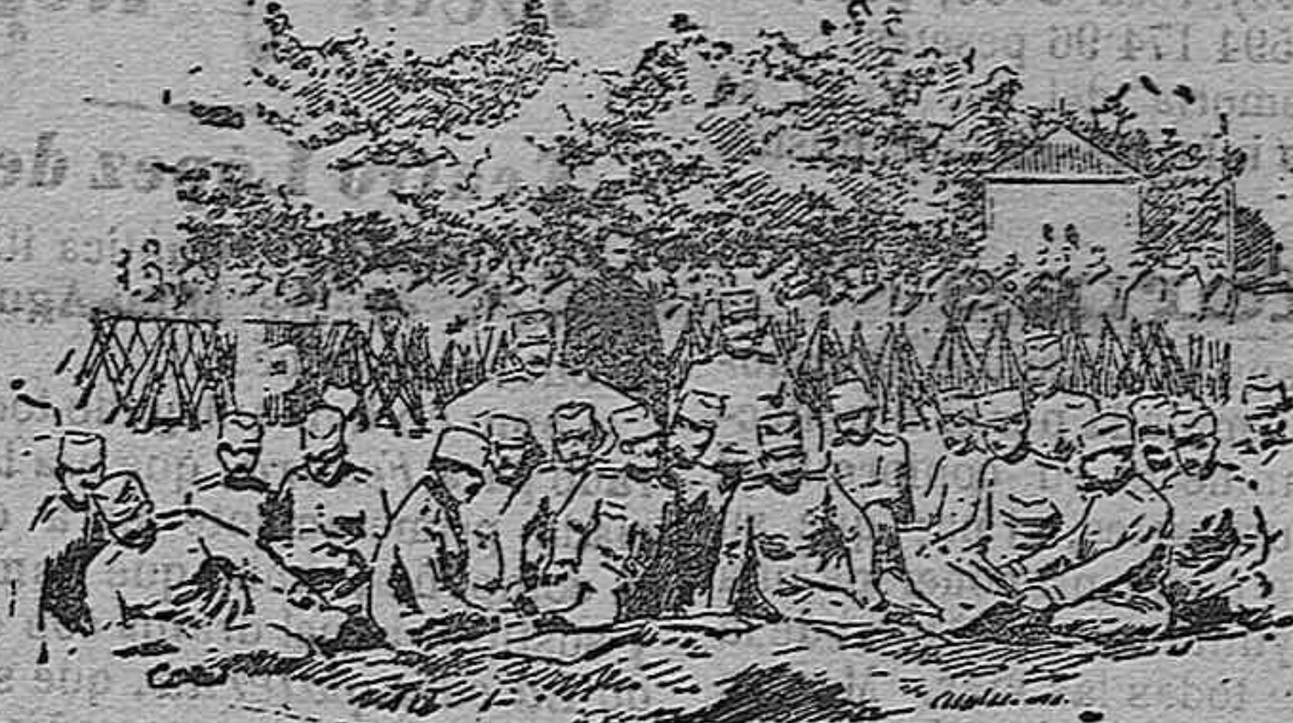
Campamento búlgaro en las proximidades de la línea de Tchataldja.

lla misera zona es el mayor de los tormentos imaginables. Toda la provincia emigra sin saber adónde; los campos quedan sin frutos y sin hombres; los ganados perecen faltos de pastos; los colonos entregan á los amos las llaves de los cortijos y vendiendo sus muebles embarcan en Almería; familias enteras cruzan las polvorientas y destrozadas carreteras y abarrotan los trasatlánticos.» Como en España este término de la Chapinería que, según se lee en el Diccionario Geográfico de Madoc, vivía antes ricamente de los encinares que poseía, y hoy talado sus montes, se ha visto invadido por las fiebres intermitentes, que antes no se conocían; por la miseria, que obliga á servir á Madrid con un contingente de 60 á 70 criadas, con sólo 270 familias que cuenta; por el fisco que embarga diariamente los patrimonios que se creían más firmes; por las tabernas, donde, según fase de Costa, se pierden las fortunas y las almas.