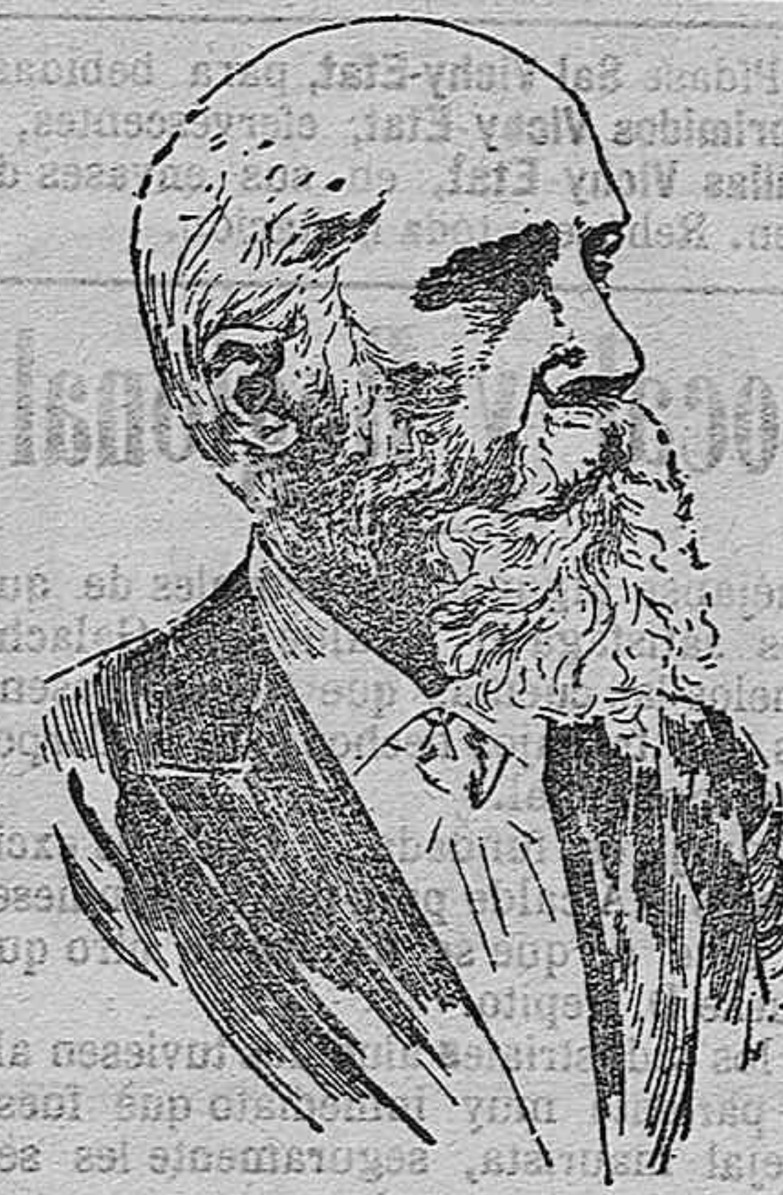
D. Rafael María Labra