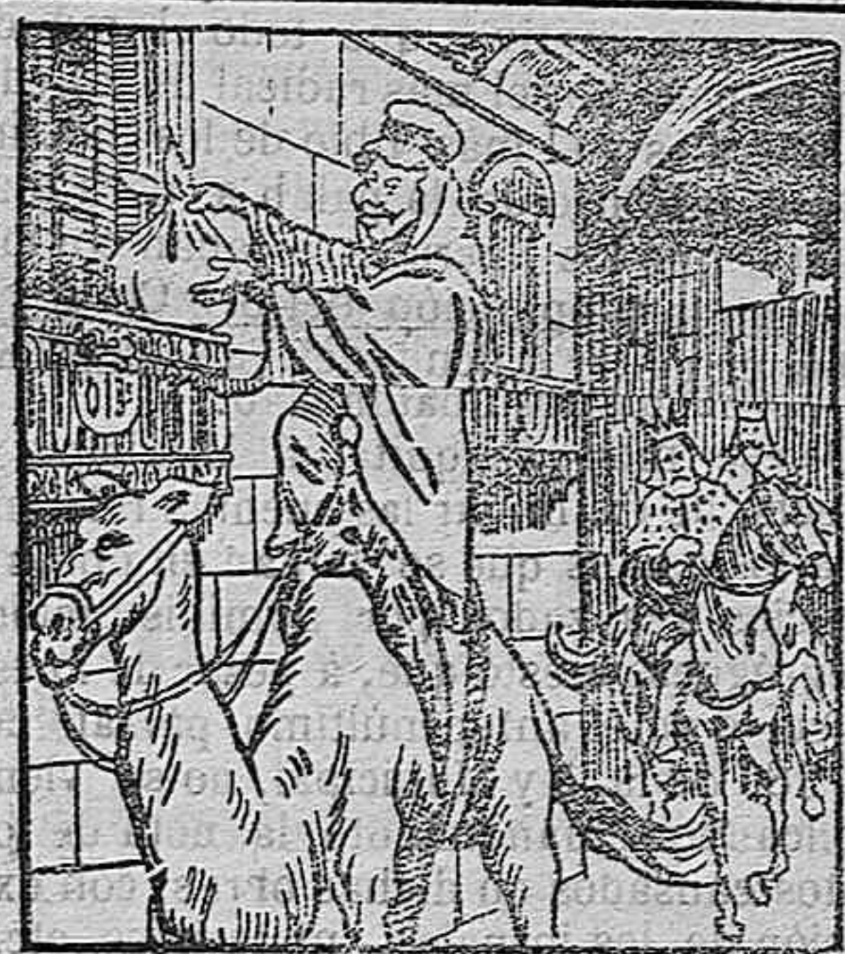
A perro flaco... ó lo que nos trae el rey moro. —Aquí este lío... ¡y divertirse!