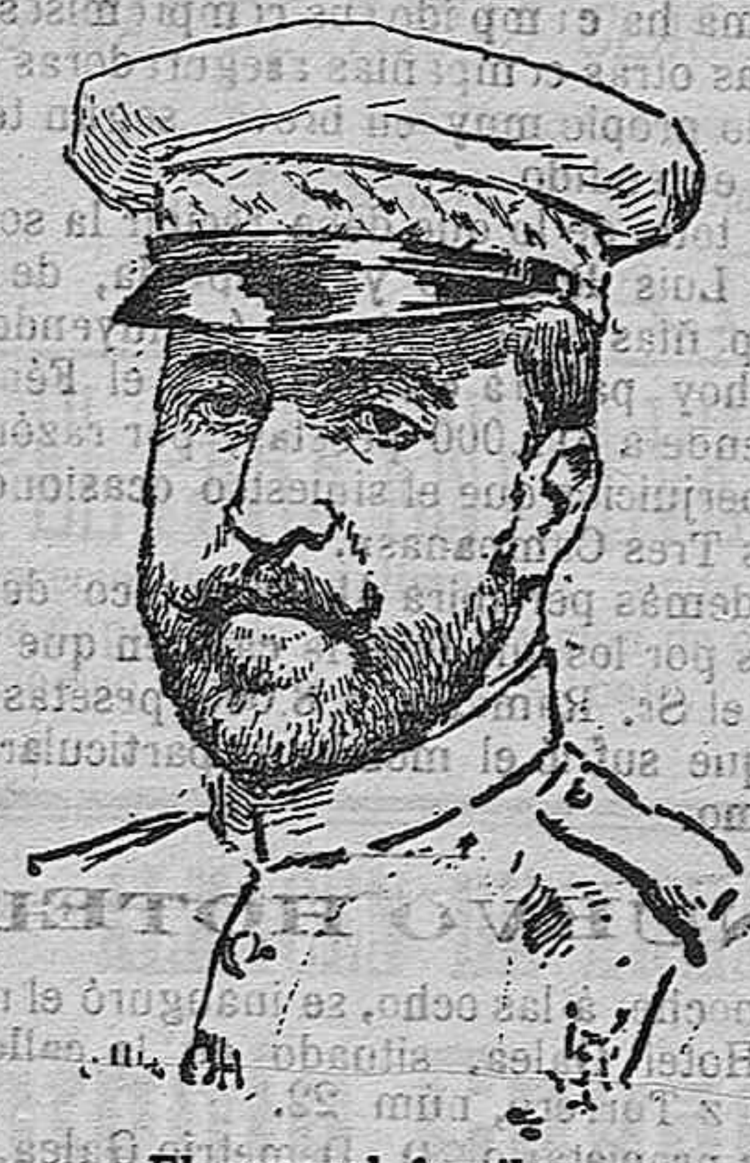
El general Aguilera