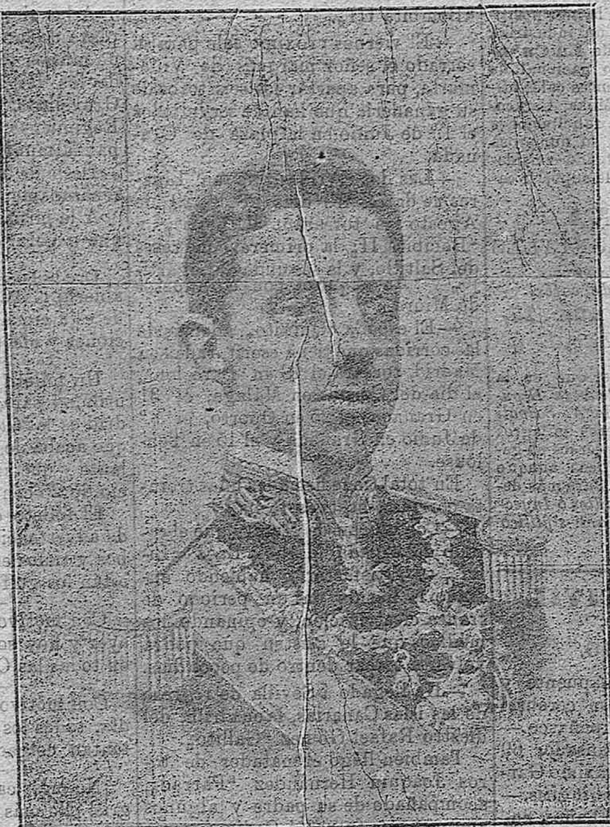
S. M. el Rey Don Alfonso XIII.

De tiempo atrás viene preocupando á los políticos y á muchos que no lo son, las consecuencias que pueden sobrevenir de este acto, que efectivamente pudieran ser trascendentales para la nación, por que si bien se nos asegura que el monarca posee á pesar de su corta edad—vasta instrucción, ésta no es suficiente por si sola para regir los destinos de la nación, y todos sabemos el gran papel que juega en nuestros actos la práctica y la experiencia: la teoría solamente, por bien que se posea, no basta para desempeñar bien cualquier arte ó ejercicio y mucho menos el difícil y penoso de la gobernación del Estado, y si los hombres de que se rodee el joven monarca se equivocan, (se equivocarán tantas veces) porque todos nos equivocamos, no se yo cómo se vá á valer para convencerles de su error y hacerles variar de su modo de pensar. Esta deficiencia pueden suplirla los viajes, los estudios del país y del extranjero, de incógnito, no como monarca, que á penas le dejará tiempo la etiqueta para sus más precisas necesidades, despacio, sin prisa, aconsejándose de aquellas personas dignas é imparciales, no de cortesanos