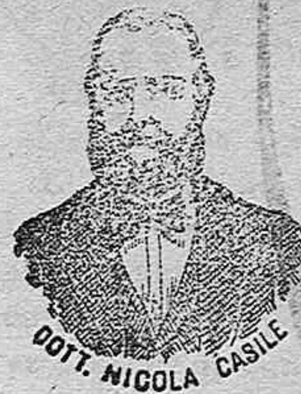
DR. NICOLA CASILE

han logrado que el Dr. Casile de Nápoles descubriera los milagrosos medicamentos que curan infaliblemente la tisis en cualquiera de sus periodos y todas las enfermedades del estómago. A la más pequeña manifestación de un resfriado, tos, catarro, bronquitis, gripe, asma (sufocación), espasmo y de cualquier enfermedad del pecho, tomar inmediatamente las Perlas Casile, que no solo curan infaliblemente estas enfermedades, sino que se tendrá la completa seguridad de no contraer otras mucho más graves. Siguiendo este método se podrá decir no más tisis. Si por descuido no se hubiera seguido este tratamiento y por desgracia cualquier persona se encontrara atacada de tisis, no tiene que apurarse porque gracias a los constantes estudios hemos podido encontrar los renombrados Confitos