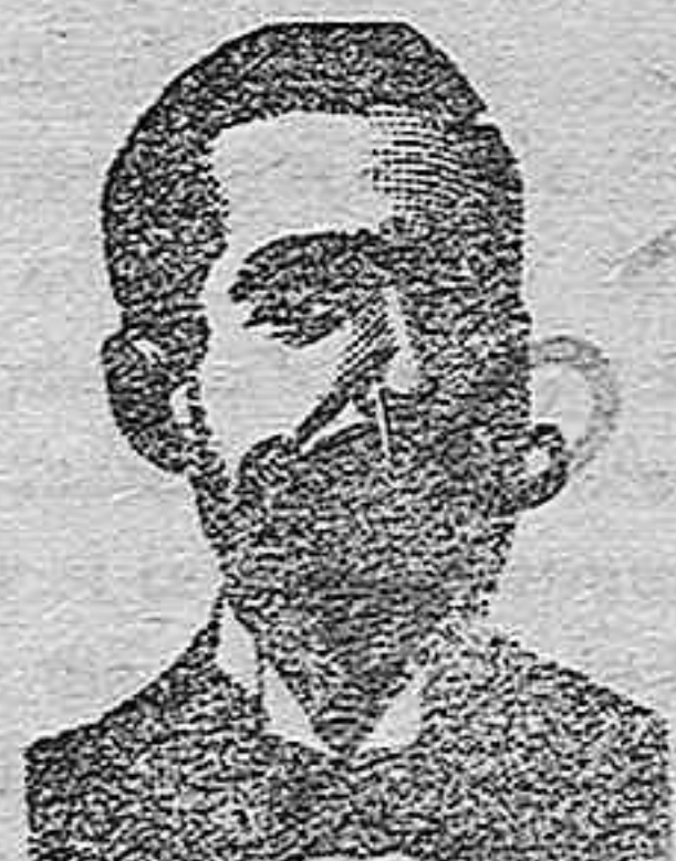
Inventor de los renombrados medicamentos

Pídanse informes y folletos al administrador del Balneario de San Telmo, en Jerez